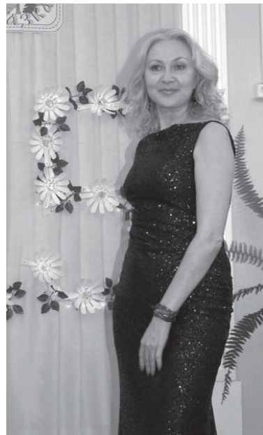
тема отдельного разговора.