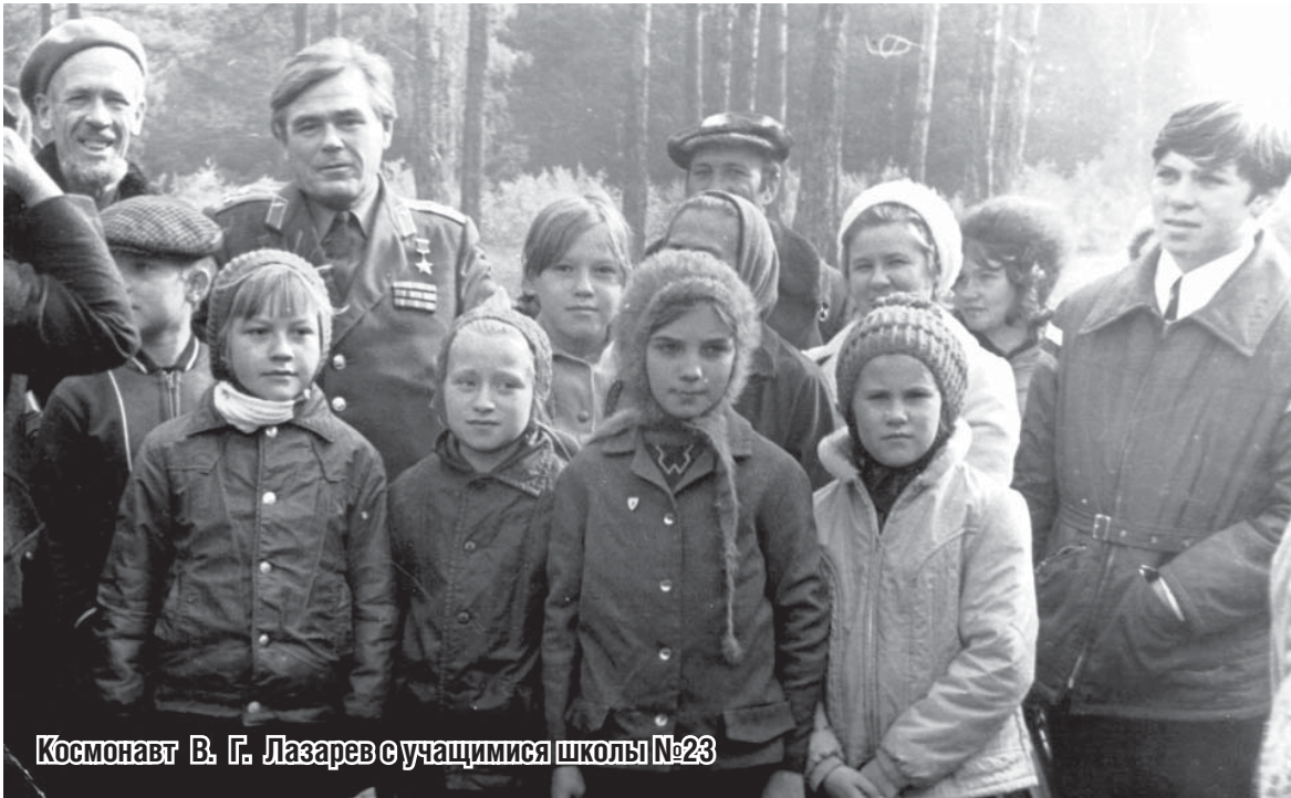
Космонавт В. Г. Лазарев с учащимися школы №23