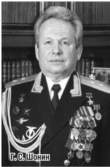
Родине. 28.09.1975 г».

В 1975 году с таким же визитом в Сысерть приехал летчик-космонавт Георгий Степанович Шонин. Он также побывал в п/л «Красная гвоздика» и на Тальков камне. О музее он оставил следующий отзыв: «Хороший музей! Он воспитывает у ребят самое прекрасное чувство – чувство любви к нашей земле, к нашей