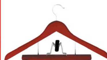
33~ Вешалка с держателем для брюк