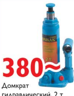
380~ Домкрат гидравлический, 2 т

г. Сысерть, ул. Коммуны, д. 39а, тел. (34374) 6-11-57