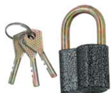
30~ Замок навесной