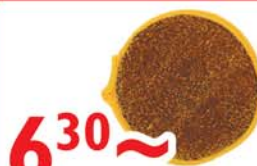
6 30 ~ Губка для посуды, 1 шт.