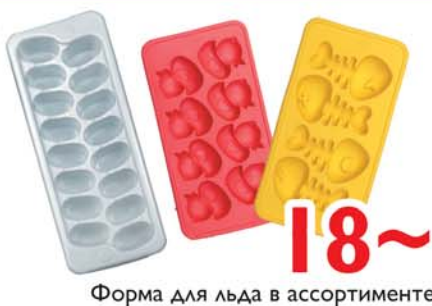
18~ Форма для льда в ассортименте