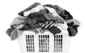
Стирка (ХВС ≈ 300 л)