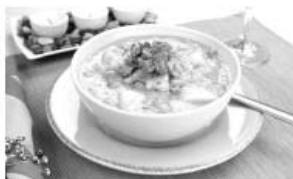
Приготовление пищи (ХВС ≈ 150 л, ГВС ≈ 150 л)