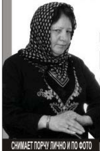
СНИМАЕТ ПОРЧУ ЛИЧНО И ПО ФОТО