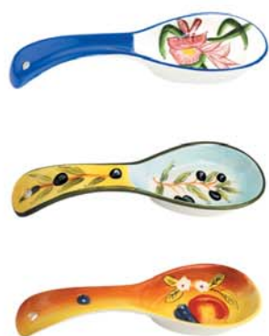
25~ Ложка подстановочная в ассортименте, Vetta