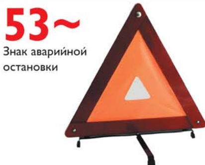
53~ Знак аварийной остановки