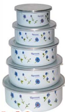
140~ Набор эмалированных мисок, 5 шт.