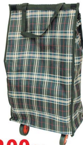
200~ Сумка на колёсах