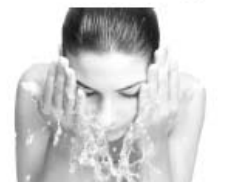
Другие процедуры: умывания, питье, поливка цветов, смыв унитаза и т.д. (ХВС ≈ 200 л, ГВС ≈ 200 л)

получив по факту реальной экономии – «умный» счетчик слишком дорогой.