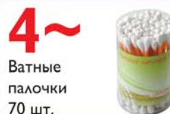
4~ Ватные палочки 70 шт.