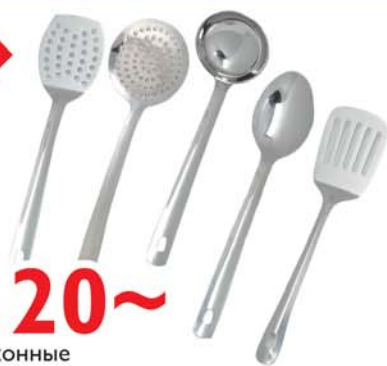
от 20~ Кухонные принадлежности в ассортименте