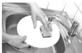
Мытье посуды (ХВС ≈ 150 л, ГВС ≈ 150 л)