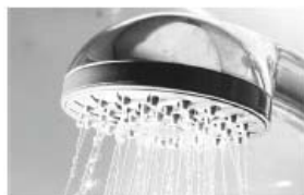
Прием душа, ванной (ХВС ≈ 1000 л, ГВС ≈ 1000 л)