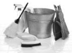
Уборка (ХВС ≈ 60 л, ГВС ≈ 60 л)