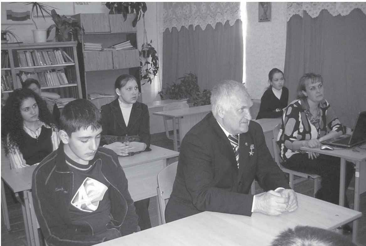
п. Октябрьский.

бая, она предъявляет к человеку очень высокие требования. Космонавт, прежде всего, должен обладать отменным здоровьем. Ему приходится работать в необычных условиях: при выведении на орбиту и особенно при возвращении на Землю на него действуют немалые перегрузки. Так, десятикратная перегрузка означает, что космонавт, например, при собственном весе 80 кг ощущает свой вес равным 800 кг. А на орбите он попадает в условия