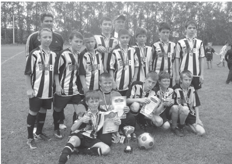
На снимке: команда «Искра» из п. Бобровский