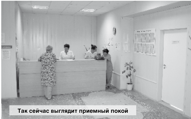
Так сейчас выглядит приемный покой