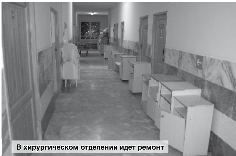
В хирургическом отделении идет ремонт