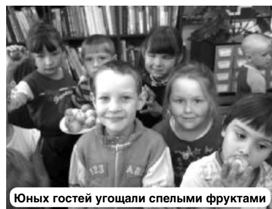
Юных гостей угощали спелыми фруктами

В этих фруктах содержатся многие минеральные вещества: