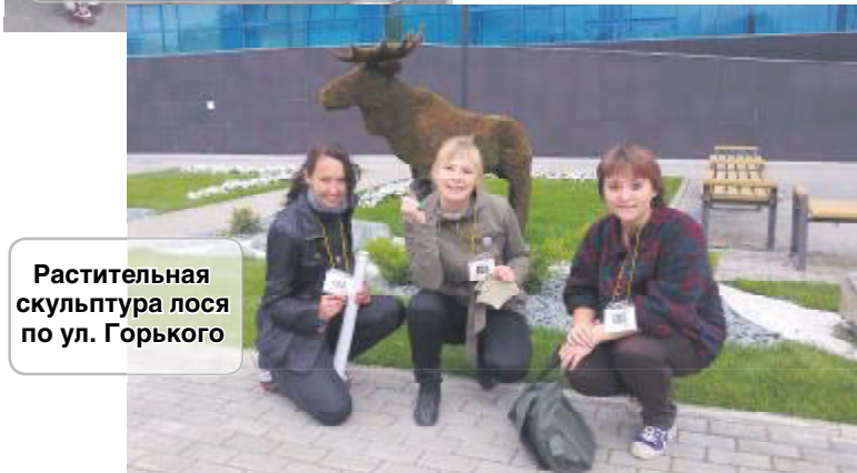
Растительная скульптура лоса по ул. Горького