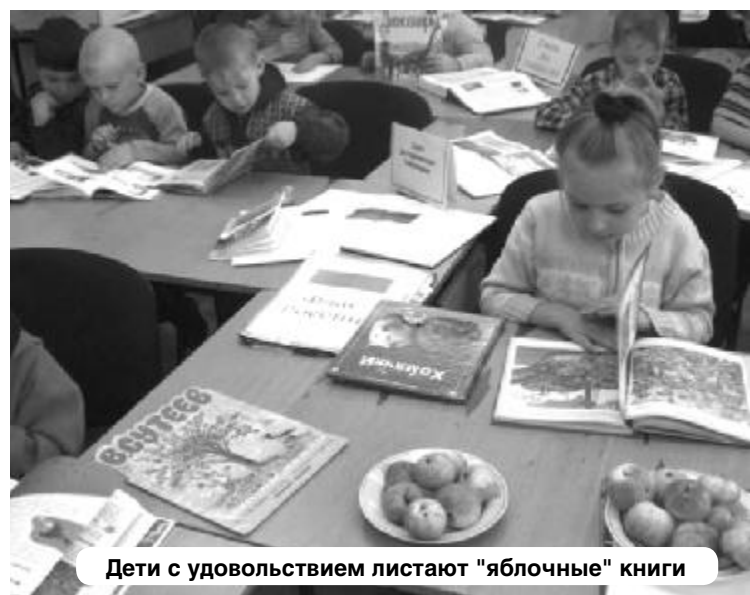
Дети с удовольствием листают "яблочные" книги

калий, фосфор, кальций, магний, натрий, железо и витамины А, С, Е, В1, В2, фолиевая кислота. Ведущие водили вместе с дошкольниками хороводы, танцевали под музыку танец. Были соревнования между командами: кто быстрее передаст яблоко,