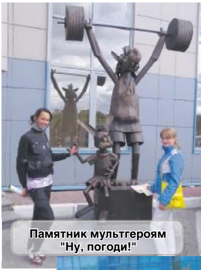
Памятник мультгероям «Ну, погоди!»

Сысерть тоже достойна подобной «двиухи». Пожалуй, стоит провести «Бегущий город Сысерть». Молодежная редакция «Форточка» будет держать в курсе любителей побегать в поисках «чек-поинтов».