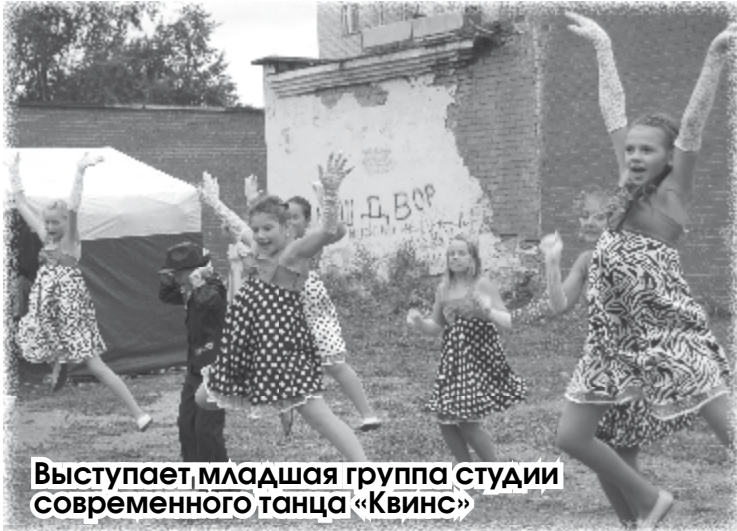
Выступает младшая группа студии современного танца «Квинс»

Серое небо, нудный дождь, и нет настроения. Значит, нужно его создать. Работники отделений участкового и срочного социального обслуживания населения ЦСОН в субботу, 17 сентября, организовали праздник для жителей многоэтажек, образующих один двор (Красноармейская, 43; К. Маркса, 87; Ленина, 38). Но какой праздник без работников культуры! «Заводили» народ сотрудники городского центра досуга и его танцевальные коллективы.