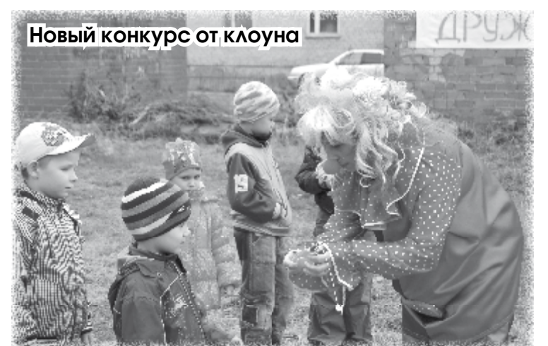
Новый конкурс от клоуна