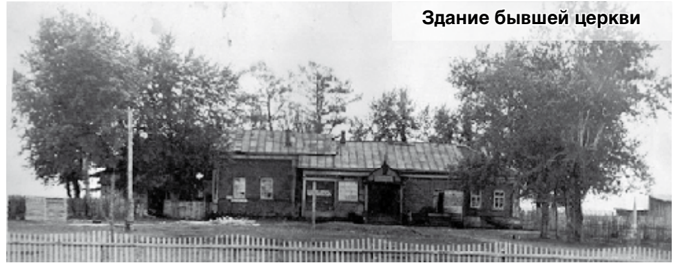
Здание бывшей церкви

В 1938 - 1939 гг. церковь оставалась единственной открытой на территории Сысертского района. По решению трудящихся в феврале 1939 года церковь была закрыта, её здание передали под школу.