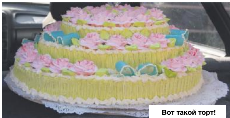
Вот такой торт!