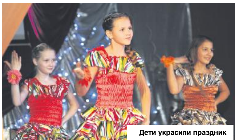
Дети украсили праздник