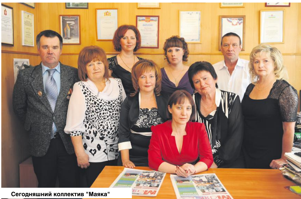
Сегодняшний коллектив "Маяка"