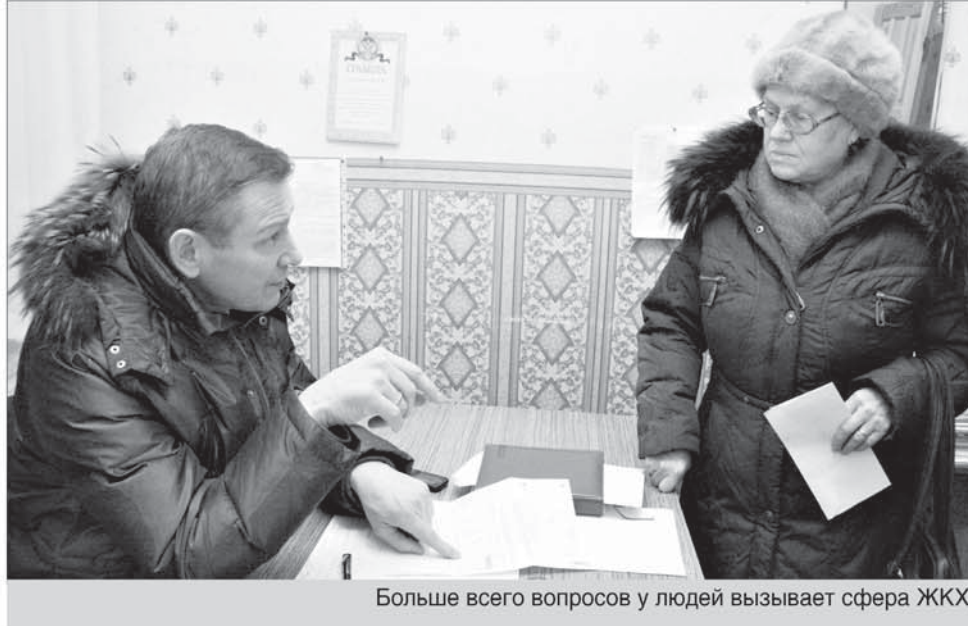
Больше всего вопросов у людей вызывает сфера ЖКХ

Специального образования у меня не было, но в то время действовала система наставничества. На Уралмаше я стал сначала учеником слесаря, а потом получил разряд слесаря-ремонтника. Самое важное в этом опыте было то, что я понял: я технар. И в этот момент появилась в Горном институте современная специальность: «Строительство тоннелей и метрополитенов». Я поступил и не пожалел об этом. На практике мы строили метро в Ташкенте, там одна станция почти полностью мной спроектирована. В институте у-