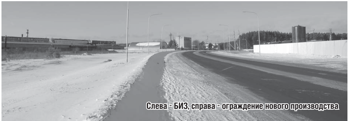
Слева - БИЗ, справа - ограждение нового производства

Планируется, что Бобровский цех будет «братом-близнецом» цеха, расположенного в Германии. Он представляет собой крытое многоуровневое помещение. Внутри огромная ванна с цинком, который расплавляется с помощью газа. В эту ванну окунаются металлоконструкции, затем они сушатся. Все это делает техника, автоматически.