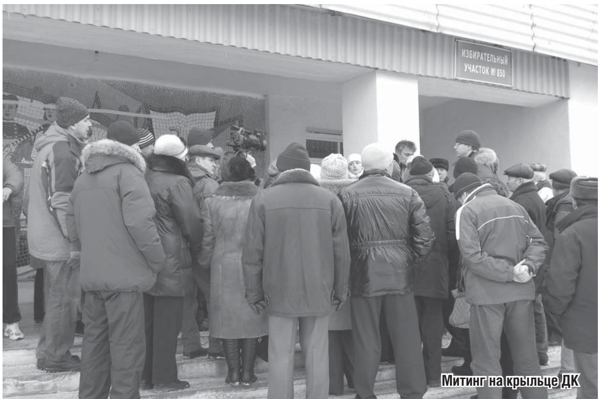
Митинг на крыльце ДК

Над ванной специальная вытяжка, подобная тем, что на наших кухнях. Все это находится в герметичной капсуле. Воздух из нее попадает только в систему очистки. Проходит через два фильтра, через жидкую и сухую очистку и то, что выходит после этого наружу, соответствует минимально допустимой концентрации.