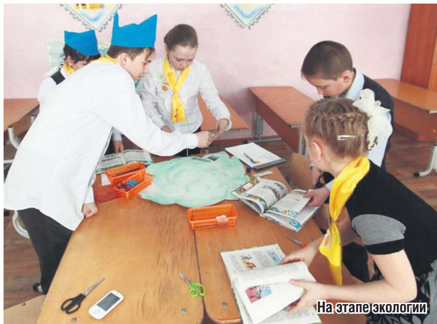
На этапе экологии