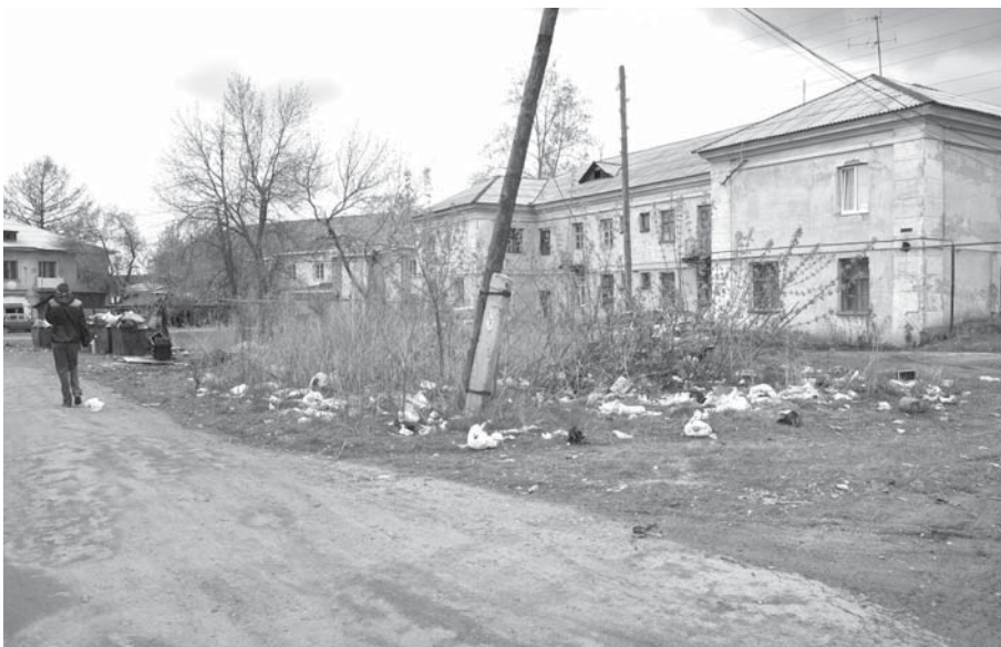
Двор дома по Тракторной, 13. Мусор лежит в радиусе 15 метров от помойки