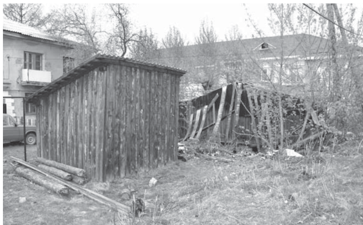
А это то, что соседствует с детской площадкой