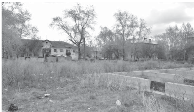
Пустырь, на который предлагают перенести мусорные контейнеры