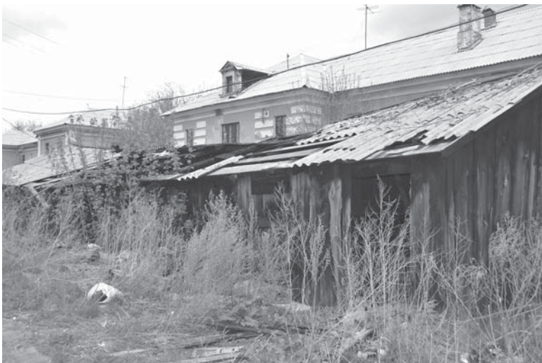
Гараж во дворе дома №5, в котором погиб мужчина

Долго ли жителям «двушек» и «трешек», как нарекли эти дома в народе, утопать в мусоре и смотреть на уродливые руины? Кто поможет решить наболевшую проблему?