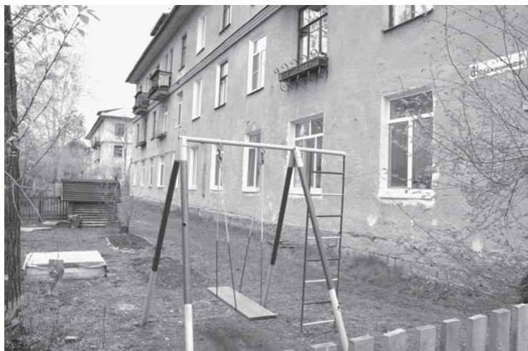
Детская площадка под окнами дома по ул. Орджоникидзе, 8

Подготовила Юлия Воротникова.