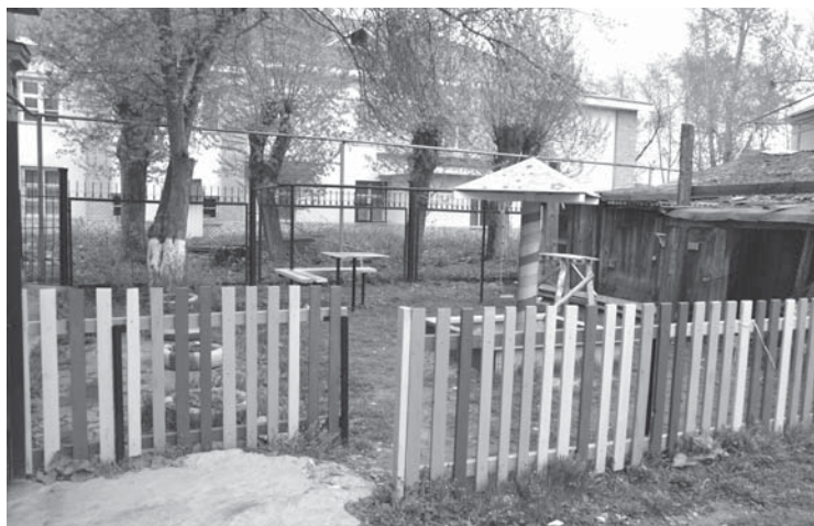
Детская площадка, расположенная за художественной школой