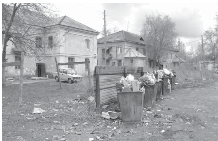
Сюда пожарным пришлось выезжать пять раз за день