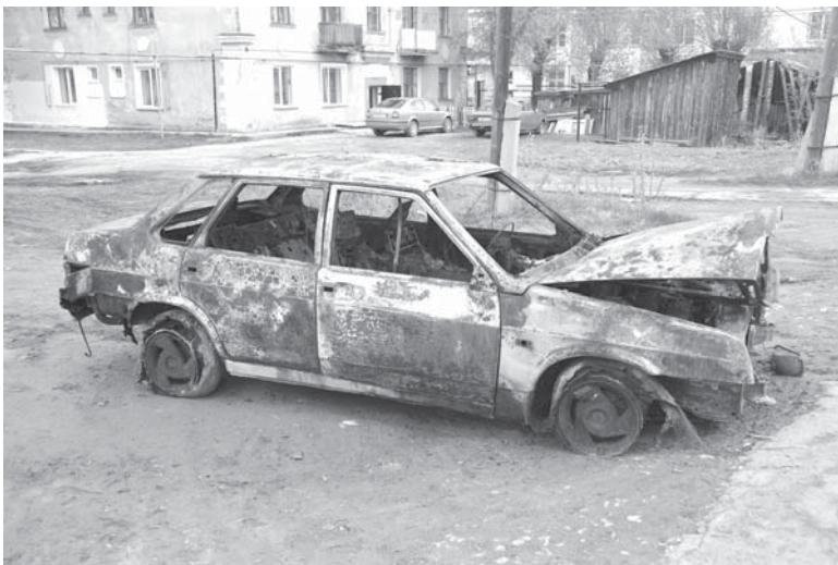
Сгоревшая машина так и осталась "радовать глаз" прохожим