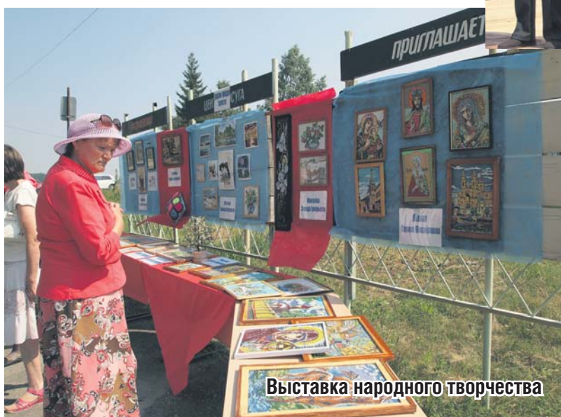
Выставка народного творчества