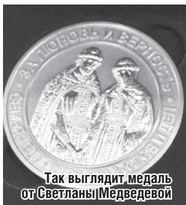
Так выглядит медаль от Светланы Медведевой