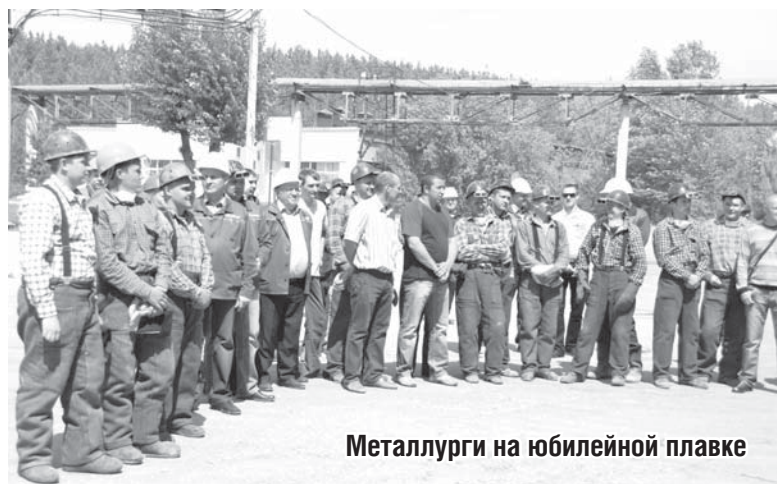
Металлурги на юбилейной плавке

В преддверии очередного Дня металлурга вспоминаются многие события из жизни Ключевского завода ферросплавов - важные вехи, о которых написаны книги, исторические справки и научные труды. А самое главное - на предприятии создан и воспитан работоспособный трудовой коллектив, реализующий поставленные задачи и передающий знания и умения новым поколениям работников.