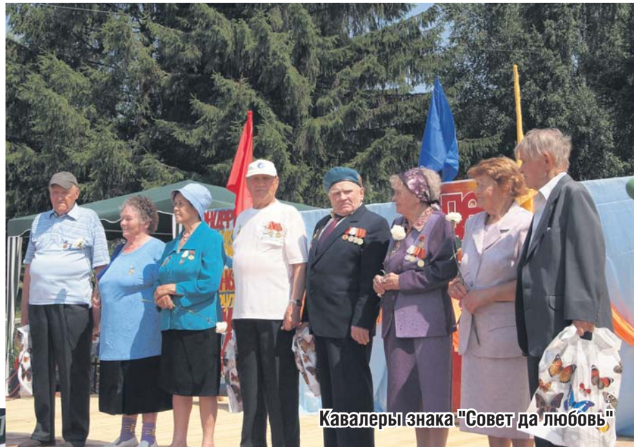
Кавалеры знака «Совет да любовь»