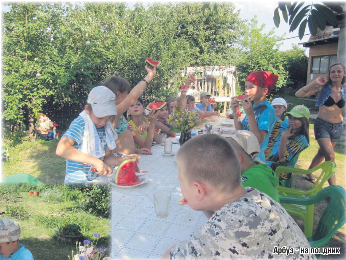
Арбуз - на полдник

Одно из самых ярких событий десятидневной смены – празднование дня Ивана Купалы. Дети готовятся к нему заранее: учат народные песни, плетут пояса, мальчишки изготавливают кораблики, де-