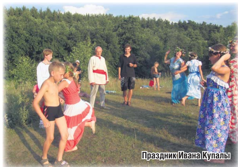
Праздник Ивана Купалы