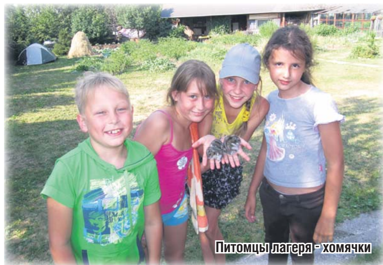
Питомцы лагеря - хомячки

вочки – венки. Ближе к вечеру нарядная процессия по кашинским улицам направляется на берег р. Сысерть (близ «Совы»). Там – хороводы, народные игры, зажигательная кадрили, прыжки через костер и, конечно, купание. В завершение праздника, загадав желания, все отпускают свои кораблики и венки на воду.