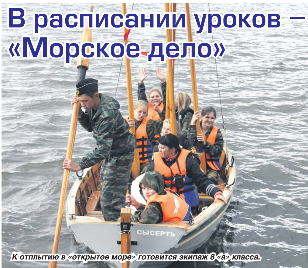
К отплытию в «открытое море» готовится экипаж 8 «а» класса.

В жизни ребят кадетского корпуса есть немало такого, чего нет в обычных школах. Например, уроки морского дела. Причем, теория, которую ребята изучают на уроках, подкрепляется практикой. В частности, в сентябре экипажи ходили на ялах по Сысертскому пруду: учились грести веслами и даже ставить паруса.