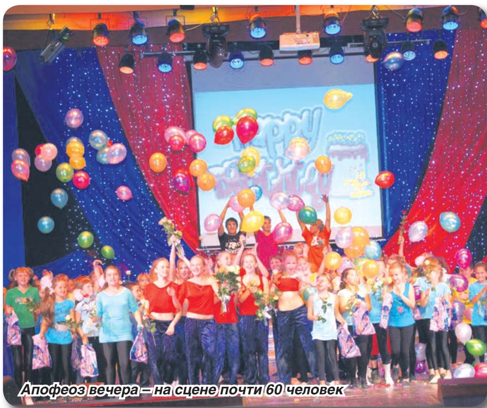
Апофеоз вечера – на сцене почти 60 человек