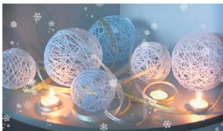
Новогодние шары из ниток

Нитки нужно обмакнуть в клей ПВА и аккуратно обмотать ими надутый воздушный шар. После того, как подсохнет, воздушный шар сдуть.