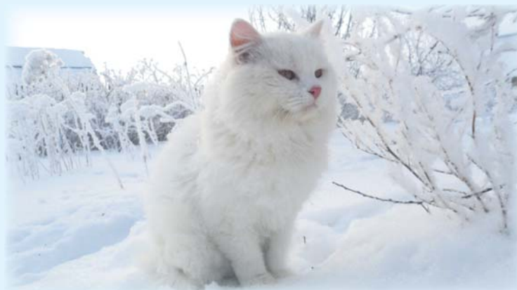
Фото Алёны Булдаковой, 13 лет, с. Никольское