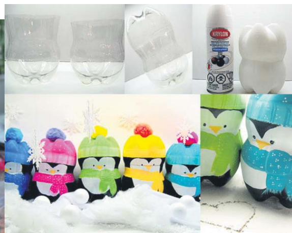
Пингвины из бутылок

Вам понадобится детские белые гольфы (или колготки), носки с цветным рисунком, пшено, стержень от оранжевого карандаша (из него делаем нос-морковку), иголки и нитки, пуговицы.