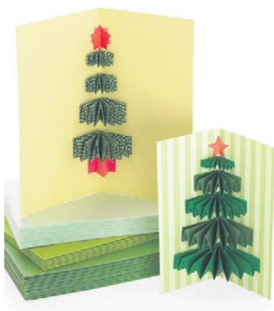
Открытка своими руками

Нитки нужно обмакнуть в клей ПВА и аккуратно обмотать ими надутый воздушный шар. После того, как подсохнет, воздушный шар сдуть.