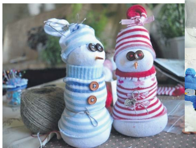
Снеговики из носка

Елочка выполнена из полос бумаги прямоугольной формы, сложенных гармошкой.