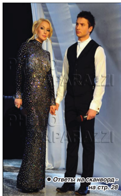
● Ответы на сканворд - на стр. 28

Подруга посоветовала диету: исключить сладкое, соленое и алкоголь... Теперь думаю: подруга ли она мне после этого?