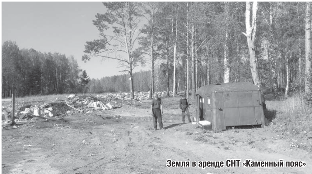
Земля в аренде СНТ «Каменный пояс»