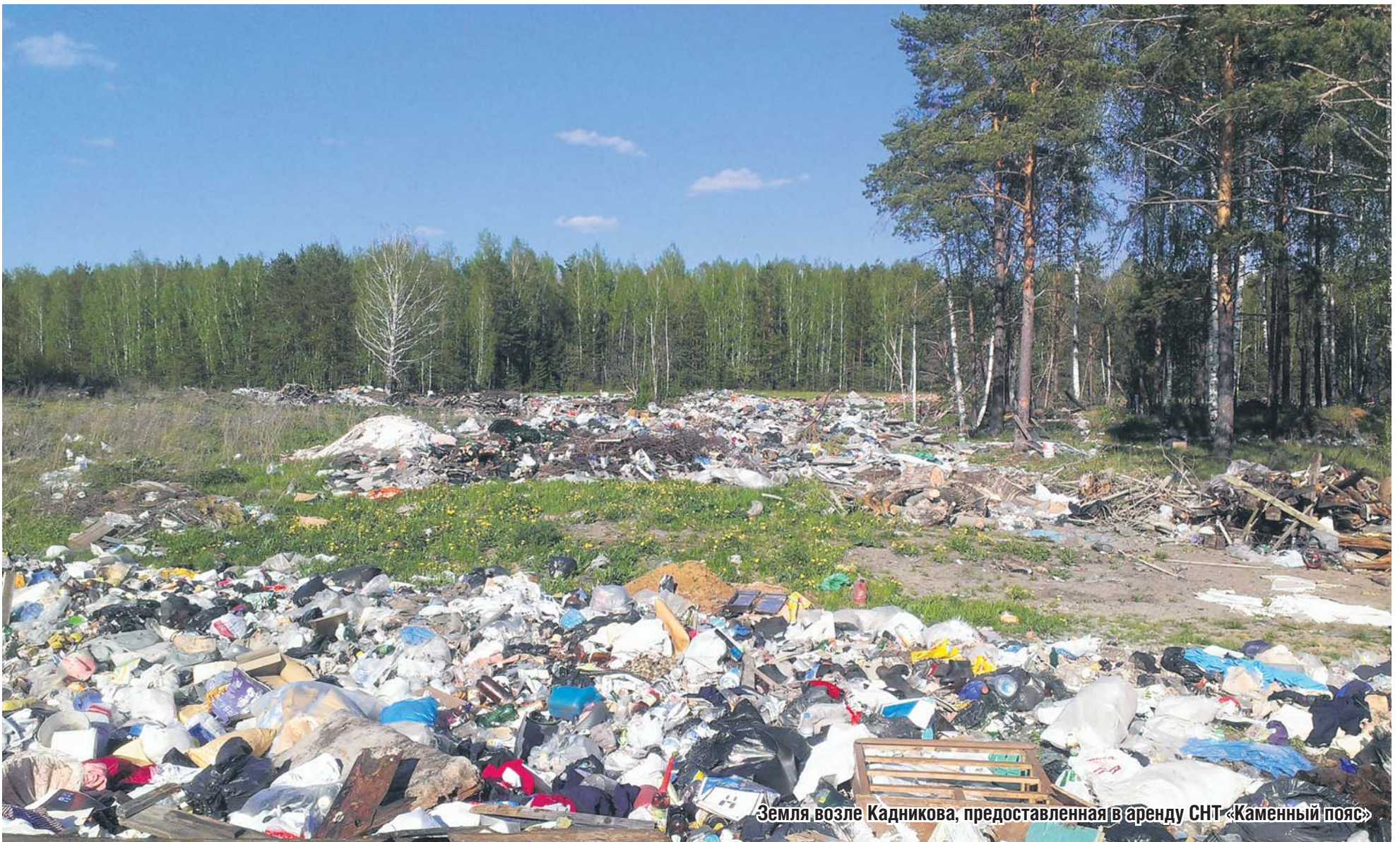
Земля возле Кадникова, предоставленная в аренду СНТ «Каменный пояс»