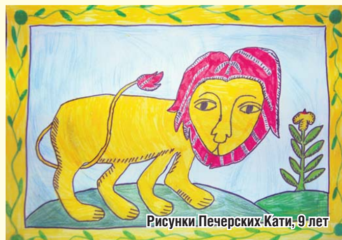
Рисунки Печерских Кати, 9 лет