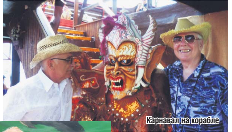
Карнавал на корабле

В состав страны входят несколько островов. Мы побывали: