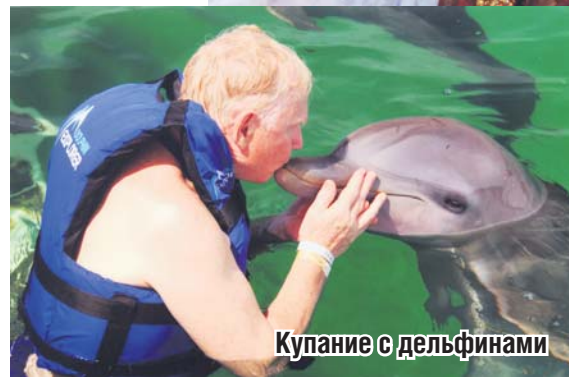
Купание с дельфинами

на Каталине, Саоне и двух безымянных, где на одном из них когда-то снималась телепередача «Последний герой». На полуостров Самана, который считают последним оплотом пиратства Карибского моря, летели самолетом 30 минут.