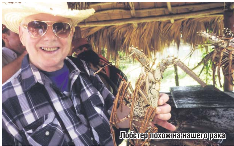
Лобстер похож на нашего рака

60% товарооборота связано с Америкой. Страна полностью обеспечивает себя продуктами. Армия – наемная, насчитывает 3 тысячи человек. Она и полиция страны созданы для охраны границы, общественного порядка и функционирования таможни. Самыми состоятельными людьми в стране являются военнослужащие, полицейские, ведущие менеджеры, врачи, инженеры и чиновники. Только они имеют право на государственную пенсию. Остальные – нет. Им выдается небольшое пособие в размере 200-250 долларов. В стране не существует декретных по уходу за ребенком. Медицинское обслуживание платное и очень дорогое. Только консультация врача стоит от 300 долларов и выше. Лекарства очень дорогие. Предпочитают лечиться народными средствами. Практически все ведут здоровый образ жизни.