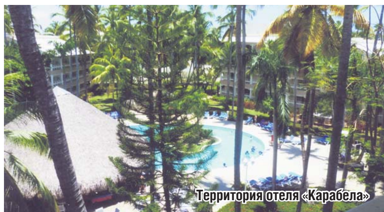
Территория отеля «Карабела»

По всей стране много сахарных заводов, которые своим производством загрязняют окружающую среду. Но руководству заводов лучше заплатить штраф, чем чистить вокруг себя. Процесс захоронения в стране такой же, как и у нас. Есть кремация. Траурный цвет – белый. После похорон обед не делают, а сразу же все расходится. Не делают и поминки. Свадьбы проходят очень скромно. Молодые расписываются и идут домой, где их ждут только самые близкие. Накрывается простенький стол: ром, мясо, рис, фасоль. При разводе детей передают отцу, полагая, что он может больше дать детям, чем мать.