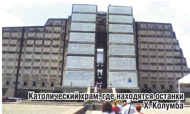
Католический храм, где находятся останки Х. Колумба

Как уже говорил, доминиканцы – мясоеды. А еще они едят кошек, приравнивая их к кроликам, поэтому кошек практически в стране нет. Любят жареные бананы и яйца. Пиво пьют только ледяное. Большие кофеманы: в течение дня постоянно пьют кофе. Российский шоколад расценивают как лучший.