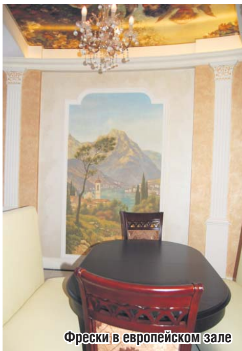
Фрески в европейском зале