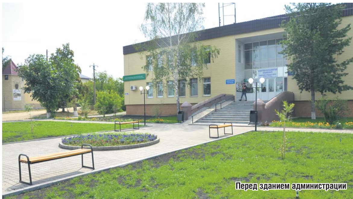
Перед зданием администрации