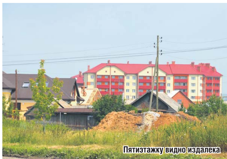
Пятиэтажку видно издалека

ку парка, и именно здесь провести День поселка. А то он все время проходит на пяточке око-