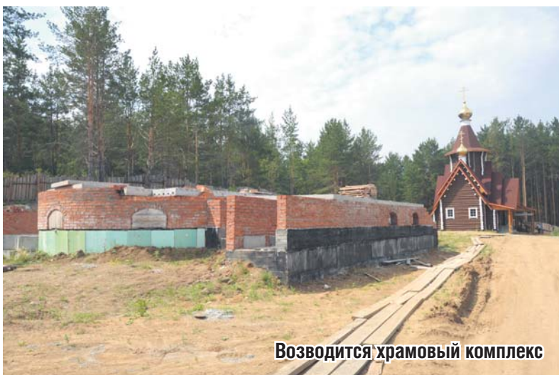
Возводится храмовый комплекс