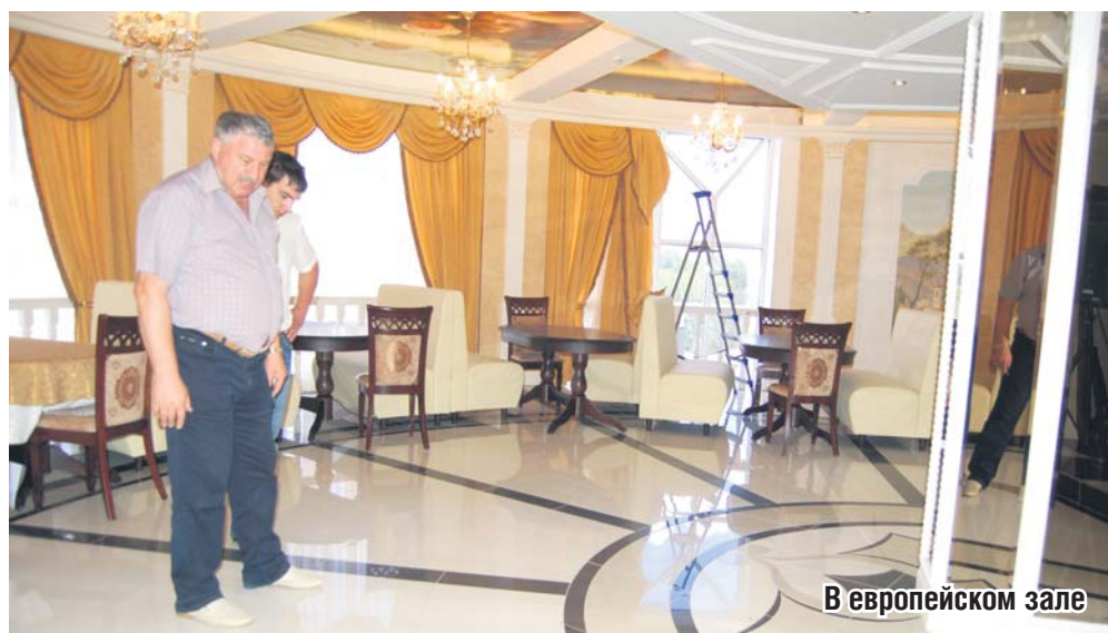
В европейском зале