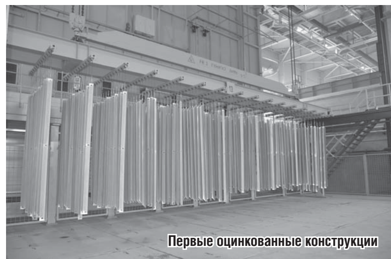
Первые оцинкованные конструкции

● Запущенный цех позволит ежегодно проводить оцинковку 30 тыс. тонн металлоконструкций. Новое производство сможет создать порядка 300 высокопроизводительных рабочих мест.