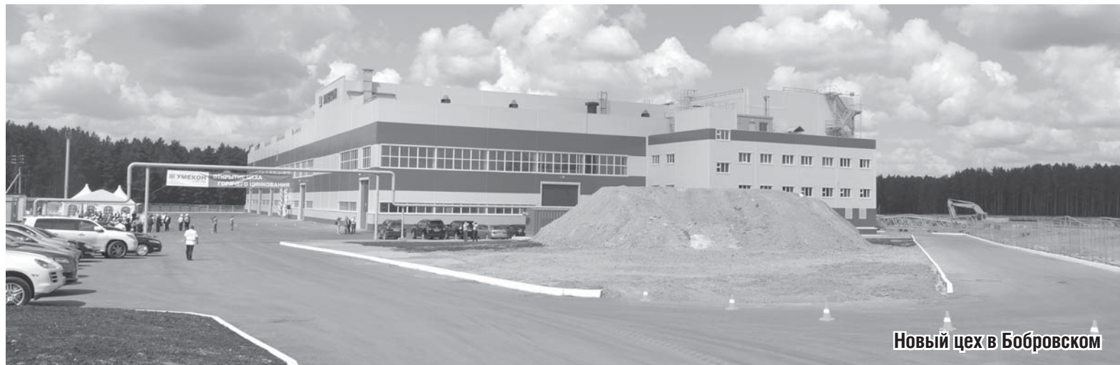
Новый цех в Бобровском

Современные импортные технологии позволяют делать оцинковку автоматическим и максимально безопасным процессом. По нормам санитарная зона предприятия всего 100 метров. Для гостей организовали маленькую экскурсию, на которой рассказали, где и как происходит оцинковка. Горячее цинкование очень важно