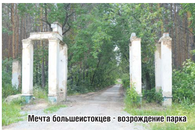
Мечта большеистокцев - возрождение парка

аттракционы. Но этого мало. Я представляю: вот бы отремонтировать вот эту сцену – центральную площад-