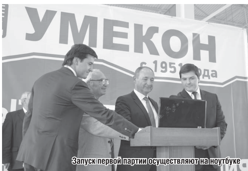
Запуск первой партии осуществляют на ноутбуке

для национальной экономики. Горячая оцинковка уже долгое время считается наиболее надежным, безопасным и долговечным способом обработки металла, которая исключает его повреждение от коррозии и механических влияний. Коррозия металлов — настоящий бич для стран с развитой экономикой. Ущерб от нее может составлять