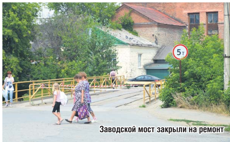
Заводской мост закрыли на ремонт