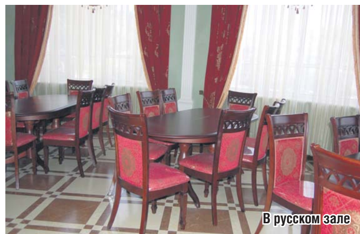
В русском зале