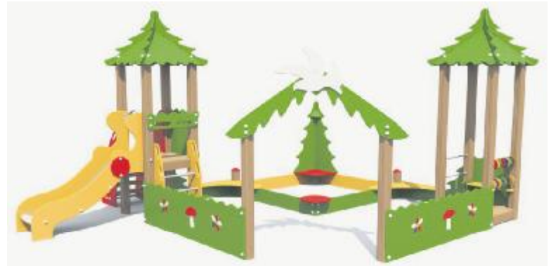
Вот так будет выглядеть один из игровых модулей, которые появятся в наших дворах.

В этих дворах после заключения контракта в течение 30 дней должны появиться новые скамейки, урны, вазоны, качели, карусель, машина с горкой, песочный дворик с горкой, беседка и игровой комплекс. А также спортивный комплекс для взрослых и детей старше 13 лет.