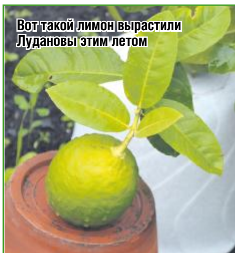
Вот такой лимон вырастили Лудановы этим летом