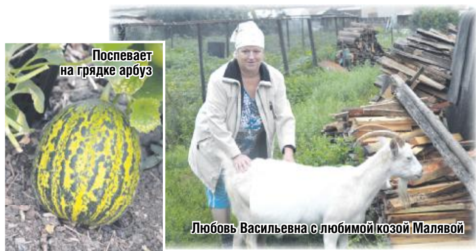
Поспевает на грядке арбуз