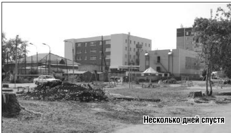
Несколько дней спустя

На прошлой неделе масштабные работы по уборке деревьев прошли во дворе дома N 35 по ул. Орджоникидзе.