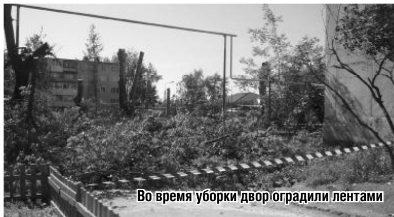
Во время уборки двор оградили лентами