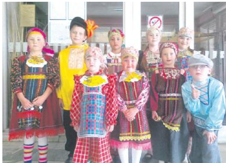
Даже если они еще совсем маленькие, как те, которых вы видите на снимке. Это – дети из театрального кружка – студии «Дебют» (руководитель И. П. Заварзина) Патрушевского центра досуга.

Маленькие артисты летом принимали участие в Дне села, с большим воодушевлением исполнив песню «Party bog everybody» знаменитых «Бурановских бабушек». Потом в селе состоялся большой концерт с участием удмуртских вокальных коллективов. Открывали его снова маленькие «Бурановские бабушки»... из Патрушей.