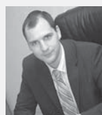
Денис Паслер, председатель правительства Свердловской области:

– Происходит качественный ребрендинг Свердловской области, переход от «старопромышленного» региона к облику современной, открытой, инвестиционно-привлекательной территории.