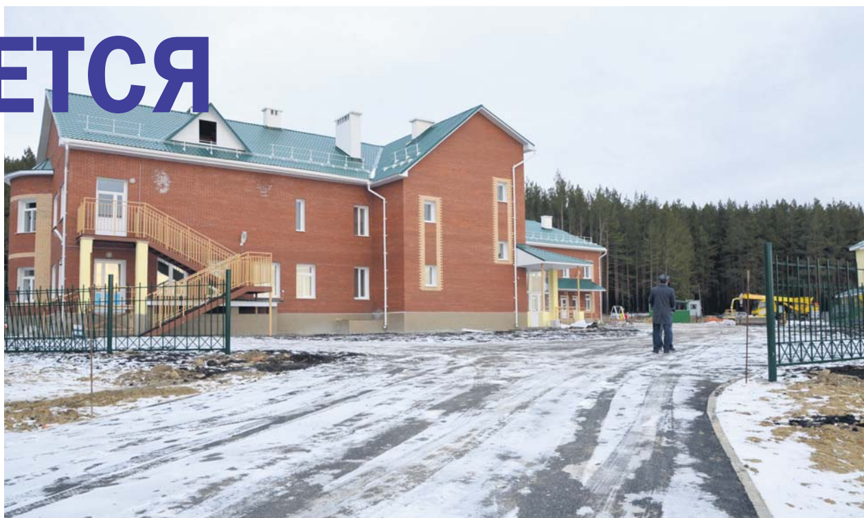
Новый детсад. Территория вокруг и на участках благоустраивается

Еще ближе к запуску детский сад. Ввод объекта запланирован во второй декаде декабря. Здесь все уже покрашено. Сейчас внутри моют и мебель расставляют. А в администрации последние котировки проводят: на поставку карнизов-