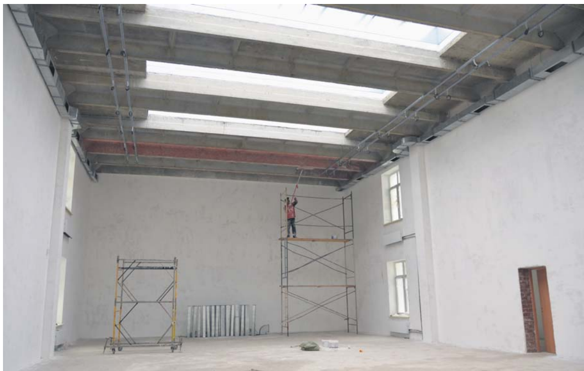
Спортзал в новой школе - с естественным освещением на потолке