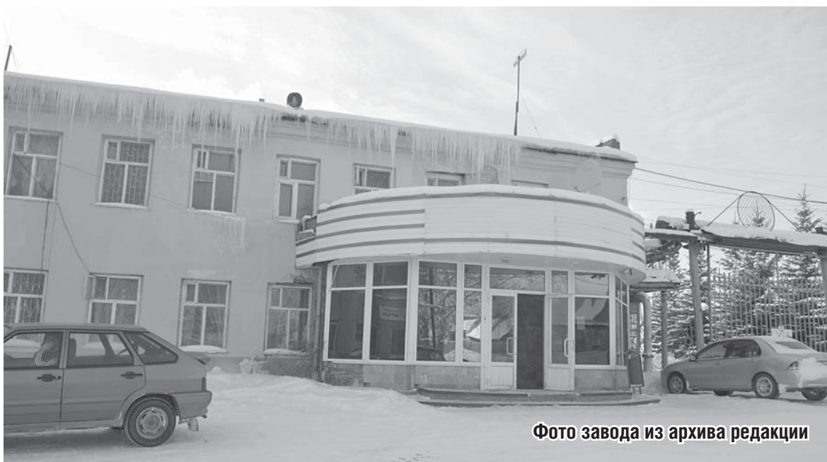
Фото завода

Что касается приватизации земли под предприятием, то она по-прежнему невозможна, так как часть участка расположена в зоне санитарной охраны источника питьевого водоснабжения. На текущий момент границы зон санитарной охраны определены в соответствии с решением исполнительного комитета Свердловского областного Совета народных депутатов №81 от 11 марта 1988 года. Никаких решений об изменении санитарной зоны правительством