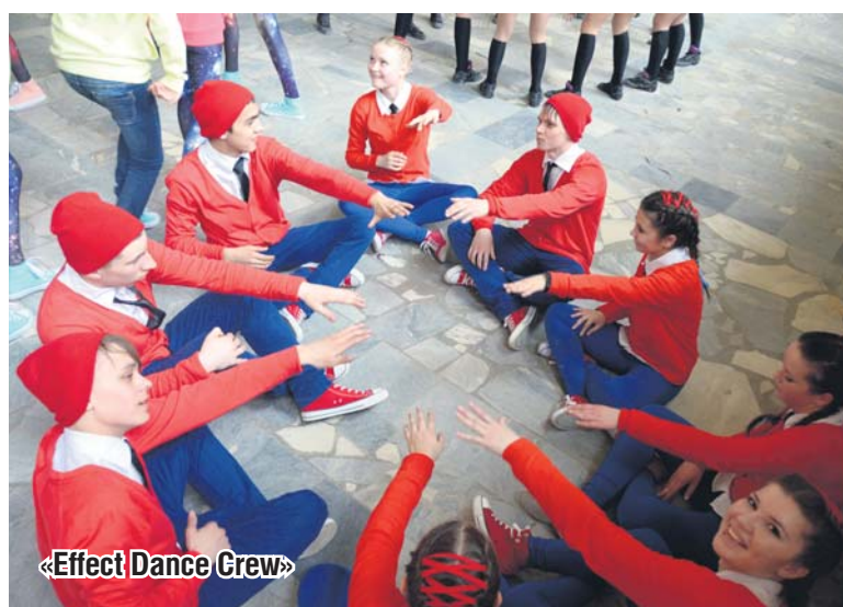
«Effect Dance Crew»

оказались недалеко друг от друга. А лидеров разделили всего несколько очков. Сами участники тоже голосовали и выбирали победителя в номинации «Приз зрительских симпатий». Его получила команда «Ретро New» из поселка Б. Исток. Школьники, несмотря на возраст и маленький опыт (в команде были ученики с 6 по 9 класс), не смущались и старались держаться на одном уровне с остальными.