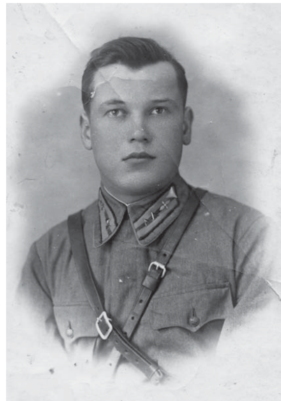
Евгеньевич Голованов, впоследствии маршал.

Наши самолеты бомбили не только переправы и скопления живой силы противника, но летали и на Берлин, и на Кенигсберг. Трудно было не только летчикам, но и механикам, занимающимся ремонтами. Больше всего запомнились степи под Сталинградом, где в мороз и ветер