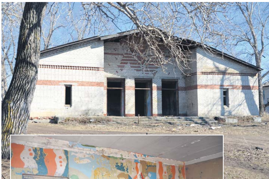
Разрушенный дом культуры