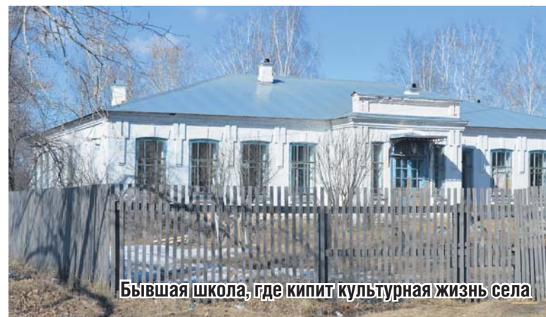
Бывшая школа, где кипит культурная жизнь села

Атмосферу библиотеки идеально дополнили портреты писателей из бывшего кабинета литературы и необычные экспонаты из кабинета биологии – чучела рака, окуна и элементы головного мозга в разрезе. Категории книг обозначены веселыми табличками, нарисованными от руки. Чуть позже на одной из стенок появились первые грамоты и много детских