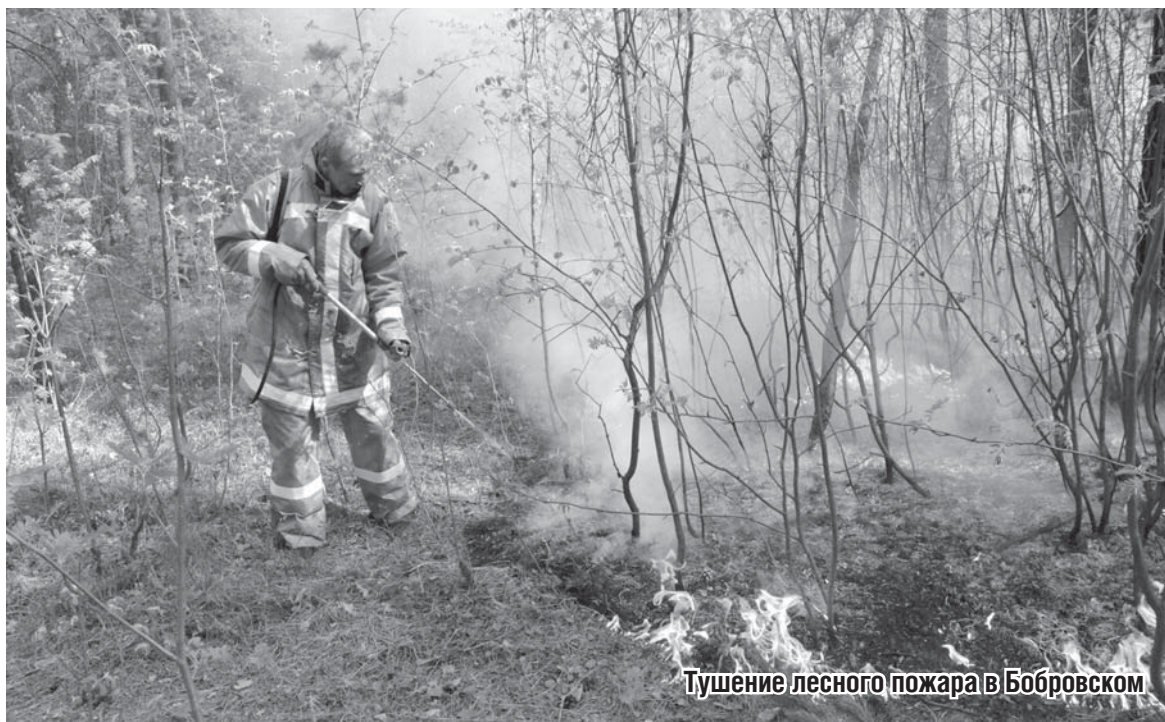
Тушение лесного пожара в Бобровском