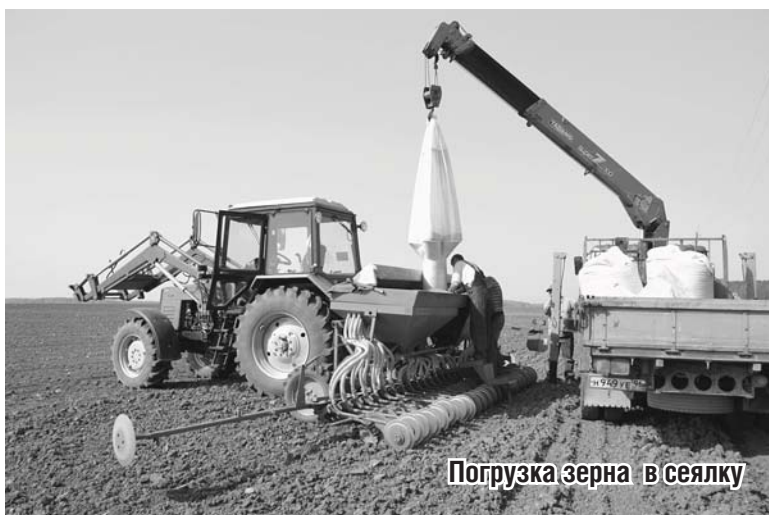
Погрузка зерна в сеялку