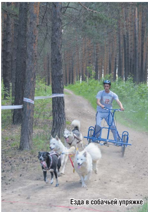
Езда в собачьей упряжке

видят ее псов – всегда бегут обниматься. Они знают, что те не причинят никакого вреда.