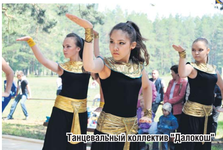
Танцевальный коллектив «Далокеш»