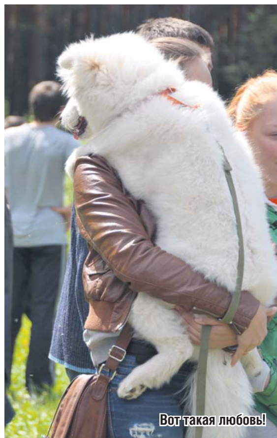
Вот такая любовь!