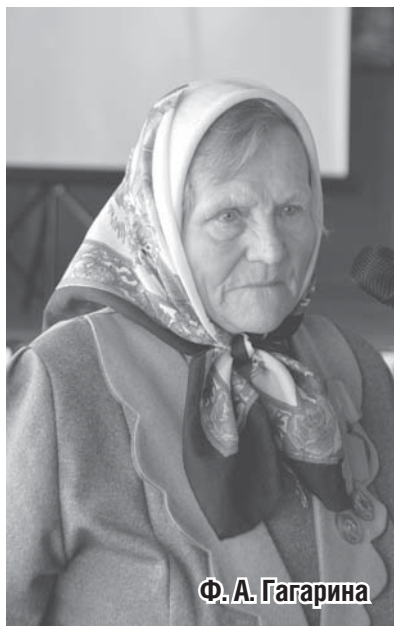
Ф. А. Гагарина