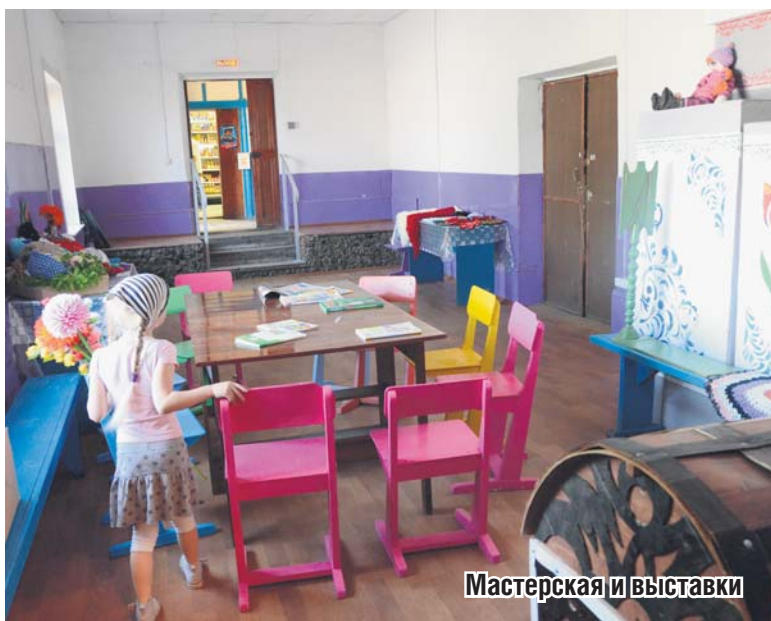
Мастерская и выставки