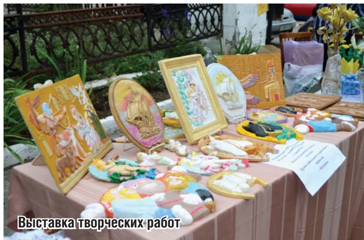
Выставка творческих работ