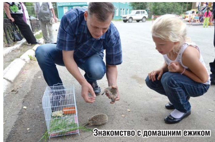
Знакомство с домашним ежиком