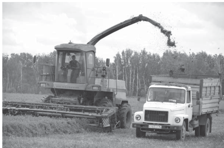
Последний день убирают люцерну. Отличная выросла. Заканчивают второй укос и скоро третий начинать можно, очень рентабельная культура.

Первое полугодие 2014-го хозяйство закончило с прибылью в четыре млн 204 тысячи рублей. После небольшого повышения закупочных цен в ноябре 2013 года стало рентабельным молоко, хотя цены на него до сих пор