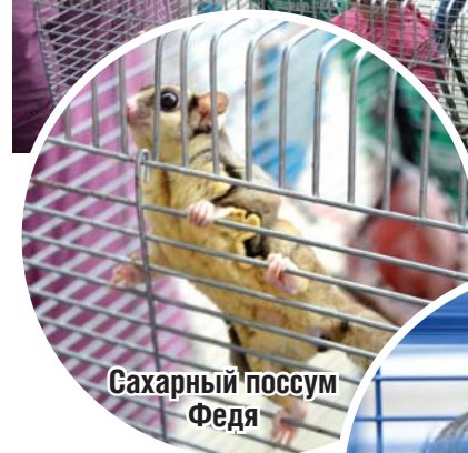
Сахарный поссум Федя