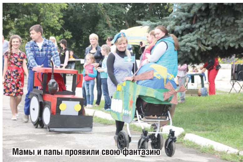
Мама и папы проявили свою фантазию