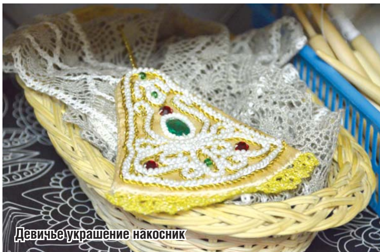
Девичье украшение накосник