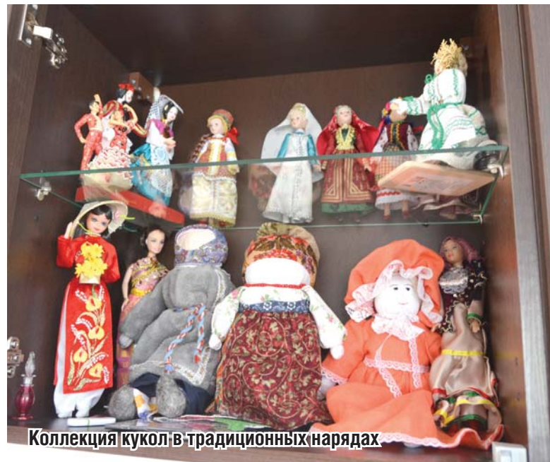
Коллекция кукол в традиционных нарядах