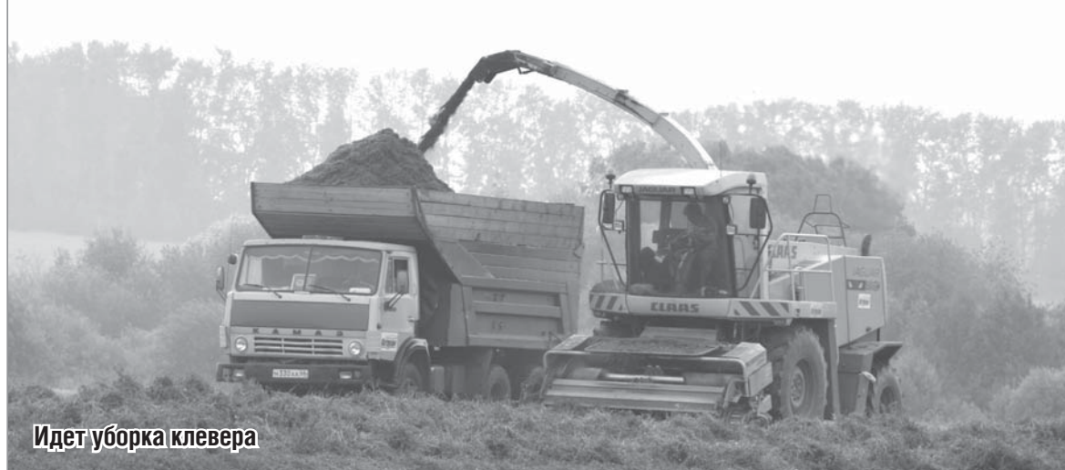
Идет уборка клевера