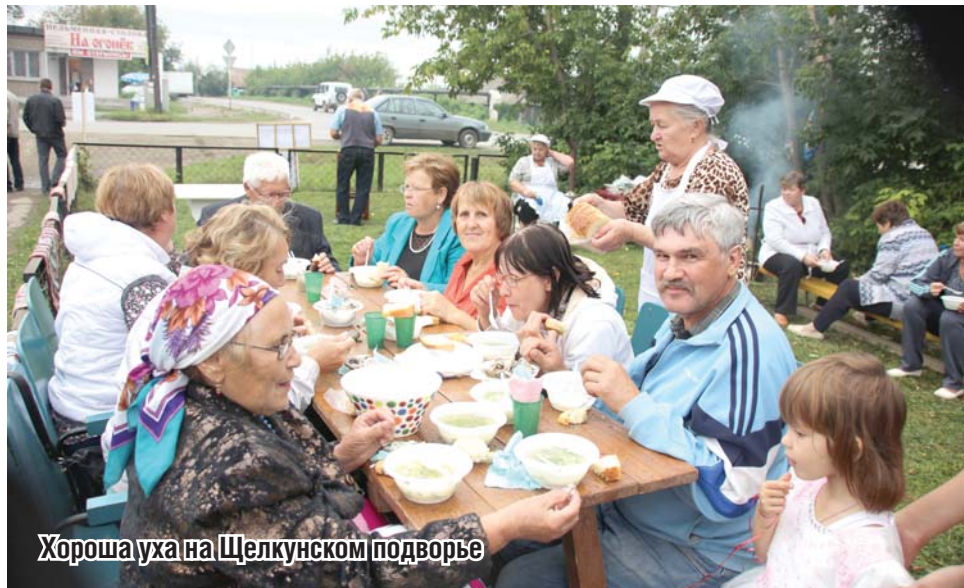
Хороша уха на Щелкунском подворье

Вечернюю программу продолжила группа «Фриденс» из Сысерти. Закончился праздник под проливным дождем и грозой, что, впрочем, не помешало щелкунцам увидеть запланированное огненное шоу и праздничный салют. И, конечно, дискотека, которую так ждала молодежь, тоже прошла на отлично, как и весь 324-й День рождения села.