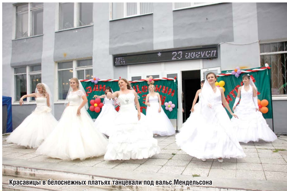
Красавицы в белоснежных платьях танцевали под вальс Мендельсона