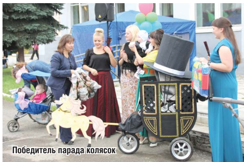
Победитель парада колясок