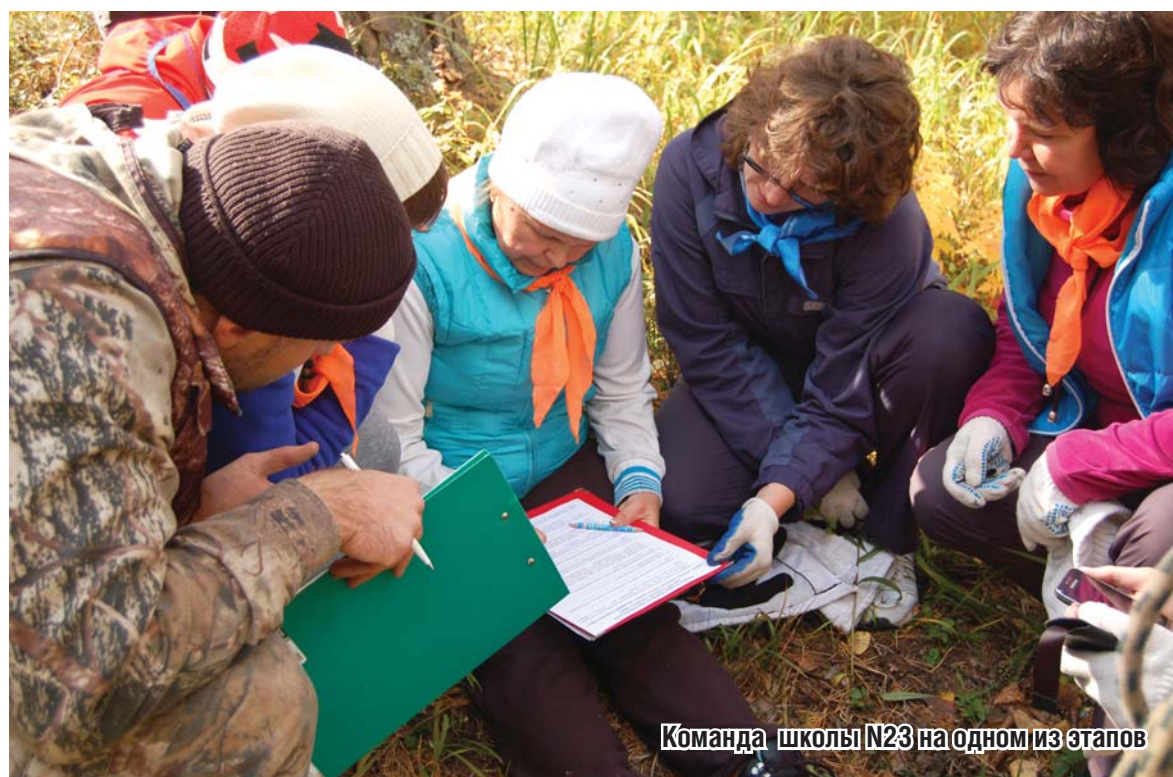
Команда школы №23 на одном из этапов