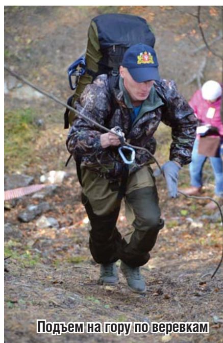
Подъем на гору по веревкам

побольше практических заданий, которые в реальной жизни гораздо нужнее.