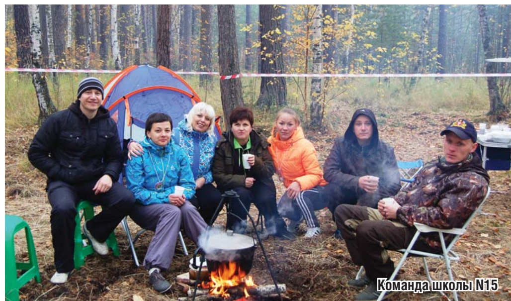
Команда школы №15