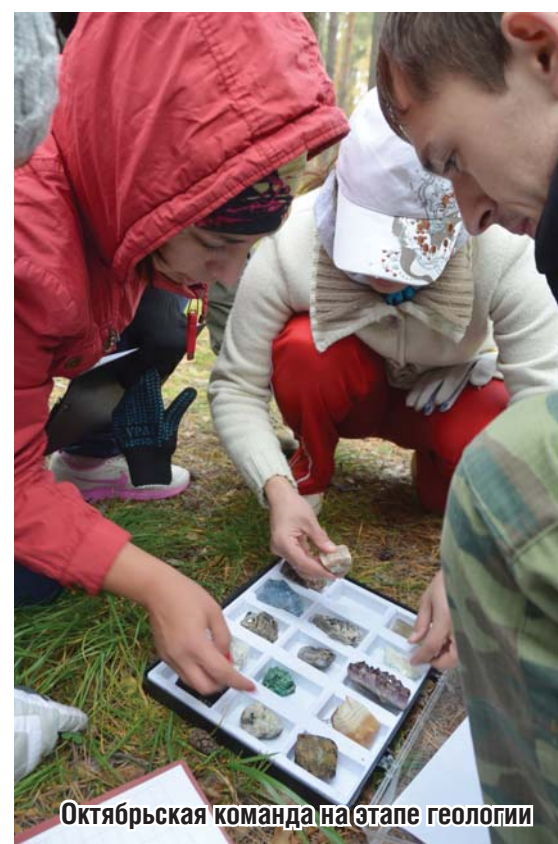
Октябрьская команда на этапе геологии