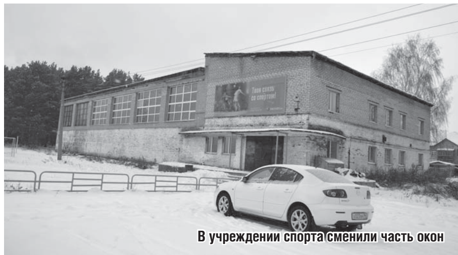
В учреждении спорта сменили часть окон

Для уборки мусора в поселке активно привлекли школьников. Ребята прошли по улицам с... фотоаппаратами. И представили главе фотоотчет «Зеленого патруля». В него попали те домовладения, возле которых складировали мусор. Потом их владельцам вручали и памятки, и уведомления, чтобы