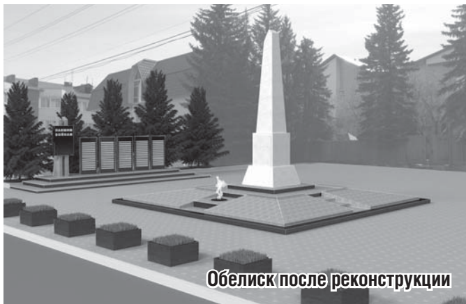
Обелиск после реконструкции