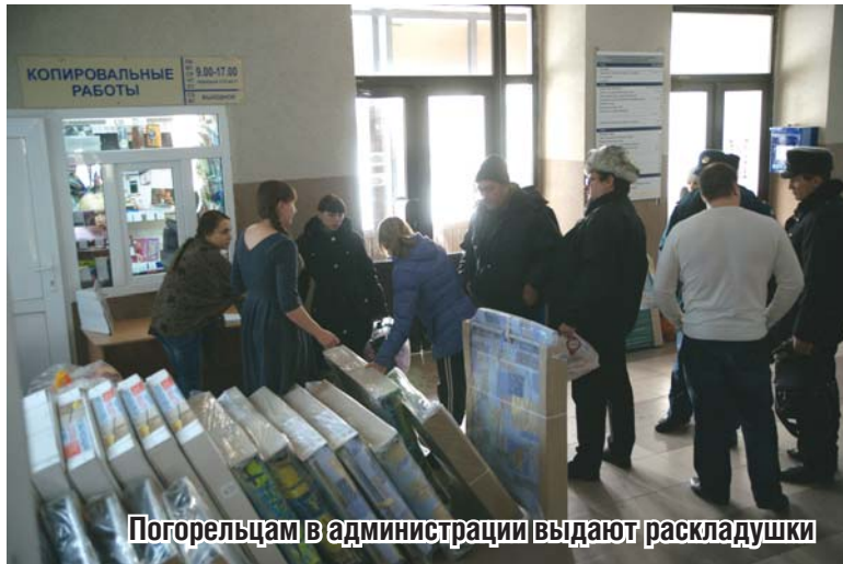
Погорельцам в администрации выдают раскладушки

Чтобы определить список нуждающихся в материальной помощи после пожара, погорельцев просят подойти в администрацию округа, в 42 кабинет, с документами. Муниципалитет окажет помощь на каждого члена семьи, зарегистрированного по адресу