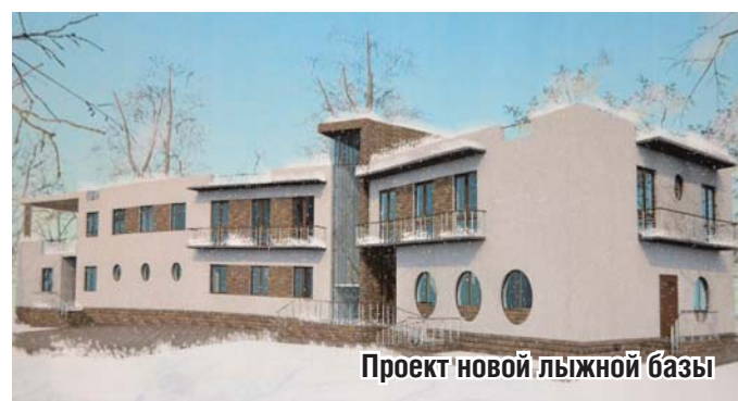
Проект новой лыжной базы