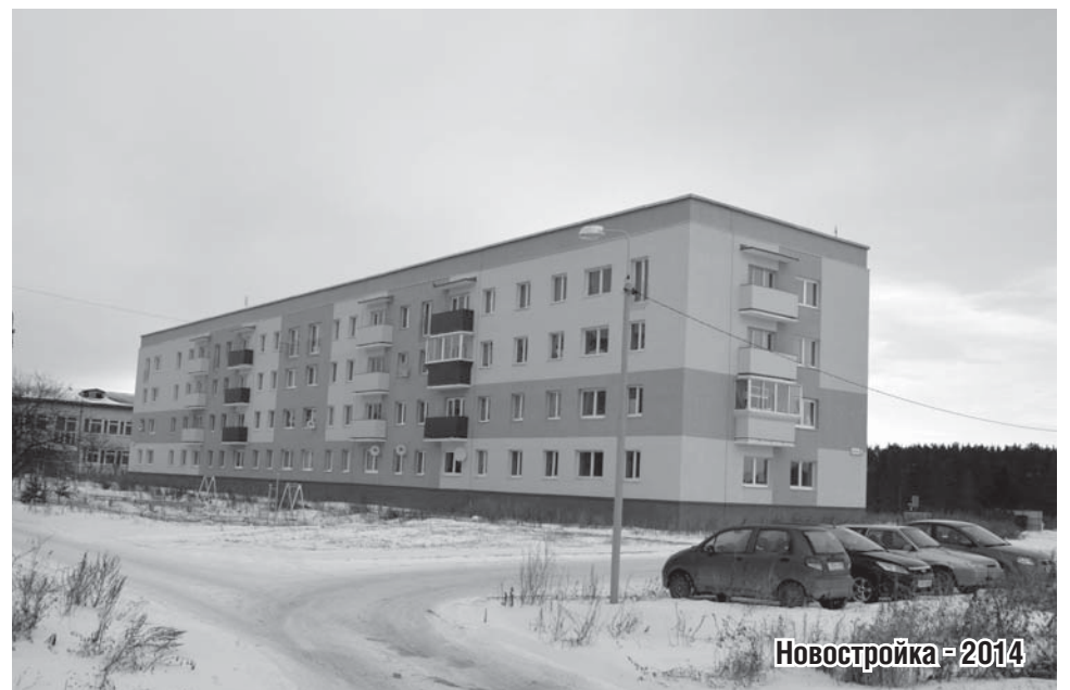
Новостройка - 2014