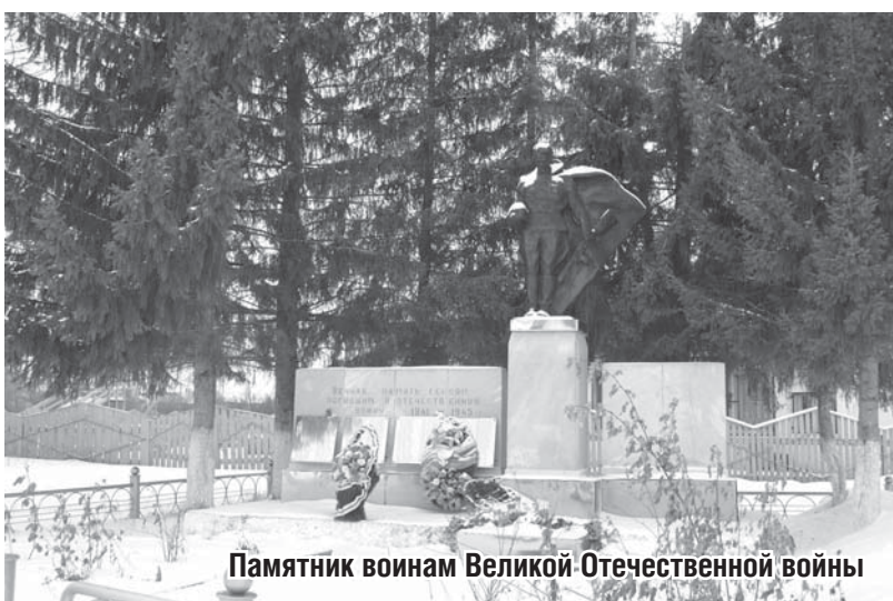
Памятник воинам Великой Отечественной войны