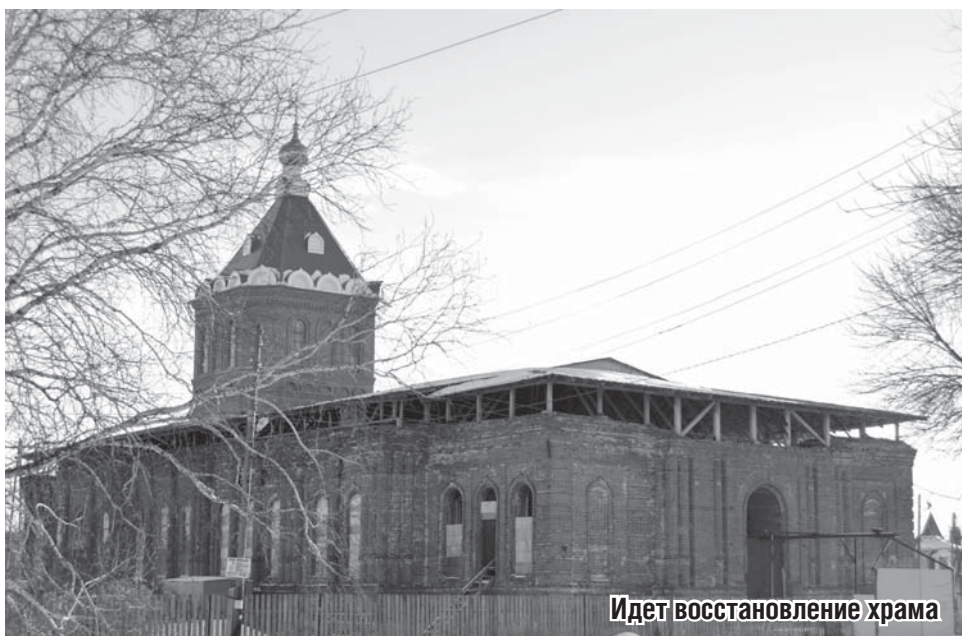
Идет восстановление храма