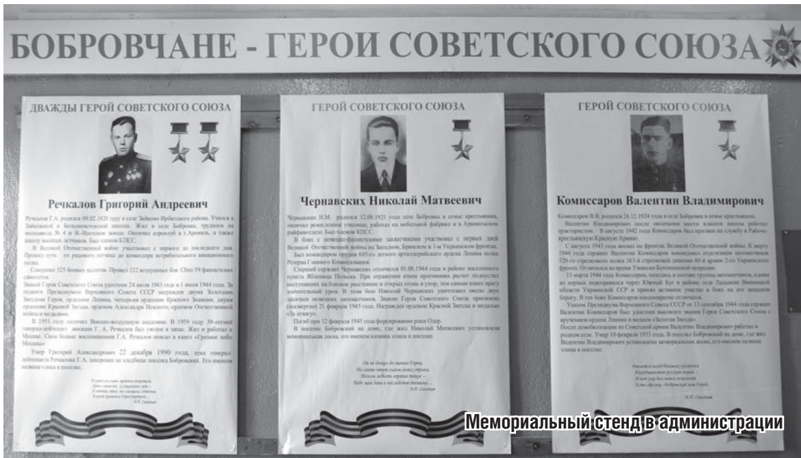
Мемориальный стенд в администрации