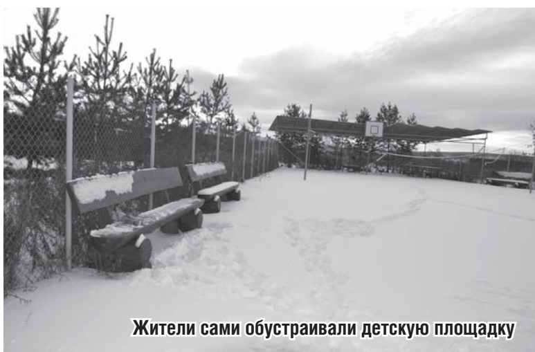
Жители сами обустроили детскую площадку

Потребность в застройке высока. Соседнее с Бобровским Косулино Белоярского района уже застроено. Арамилль тоже активно застраивается. Что неудивительно: цена на участки приемлемая и близость к областному центру.