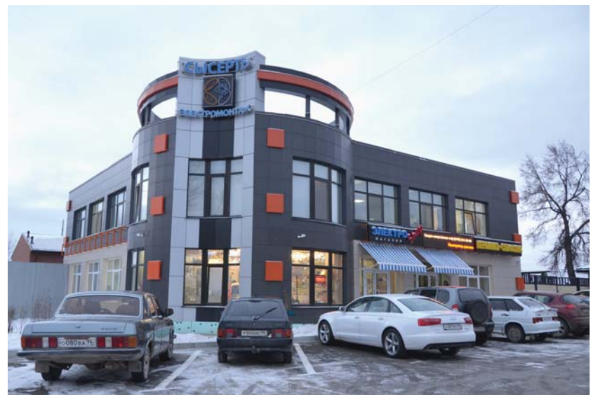
Новый офис ООО «Сысерть-Электромонтаж» с фирменным магазином электротоваров на первом этаже

Если посмотреть на географию, которую мы охватываем, то помимо нашего района, это и Белоярский, Дегтярский, Полевской, Первоуральский, Березовский, Ревдинский, Красноуфимский районы, Екатеринбург. Также на нашем оперативно-техническом обслуживании множество подстанций.