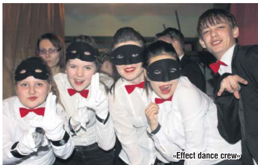
«Effect dance crew»

Наталья Беляева.