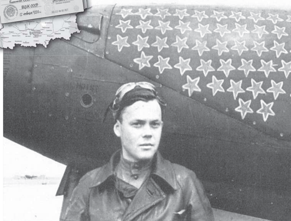
Рекорд уральца Г.А.Речкалова на американском истребителе Bell P-39 Airacobra в годы Великой Отечественной войны так никто и не побил. Воздушный ас совершил 450 боевых вылетов, провёл 122 воздушных боя, сбил 61 самолёт противника.