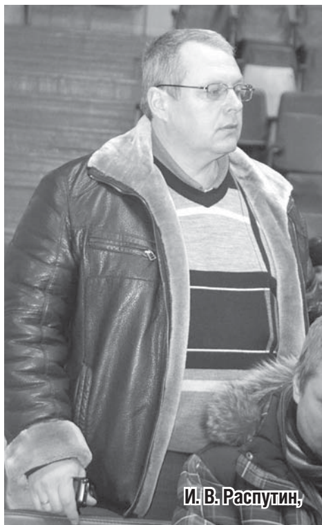
И. В. Распутин