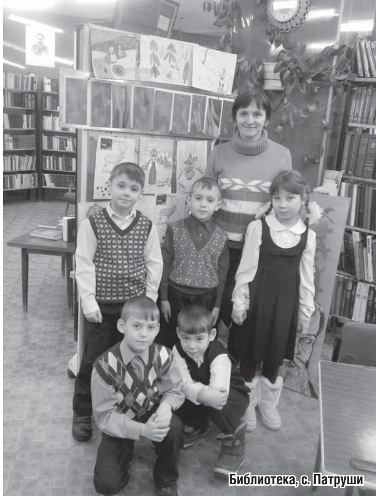
Библиотека, с. Патруши

– Семьи воспитанников приняли участие во всех четырех выставках, – пишет нам методист О. Дрокина. – Принесли книги из своих библиотек. Детям было интересно держать в руках те издания, которые читали их бабушки и дедушки. А какие красочные иллюстрации нарисовали ребята вместе с родителями. Самыми любимыми сказами стали, конечно, «Серебряное копытце», «Синюшкин колодец», «Огневушка-Поскакушка». В изготовлении поделок свое творчество проявили и родители. Использовали различные материалы: камни, бусы, бумагу, вату, дерево, глину и многое