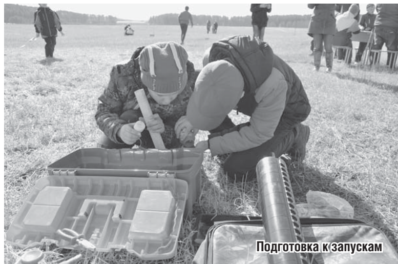
Подготовка к запускам

углов), стоящие на отдалении от места стартов. Затем по специальной формуле вычисляется высота полета.