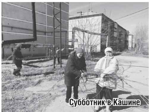
Субботник в Кашине