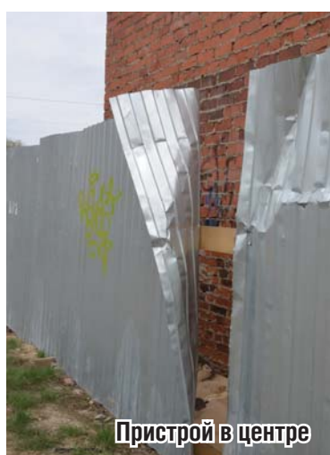
Пристрой в центре