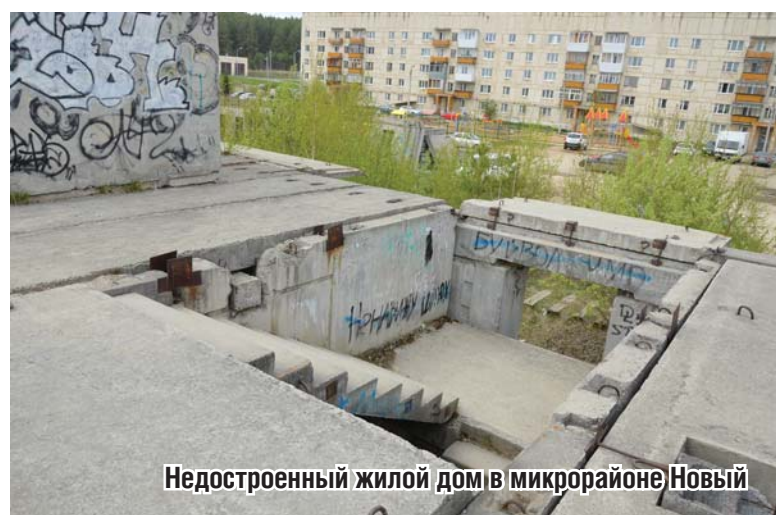
Недостроенный жилой дом в микрорайоне Новый