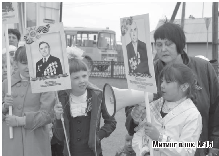
Митинг в шк. №15