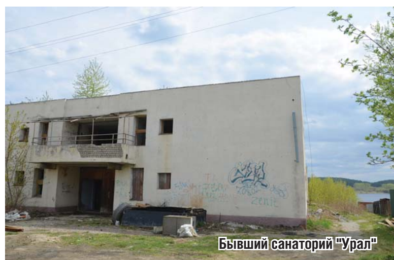
Бывший санаторий "Урал"