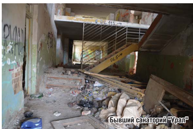
Бывший санаторий "Урал"