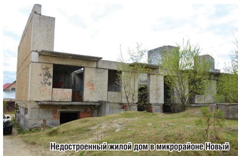
Недостроенный жилой дом в микрорайоне Новый