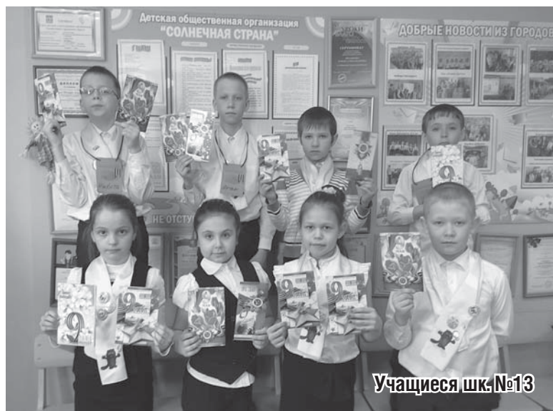
Учащиеся шк. №13