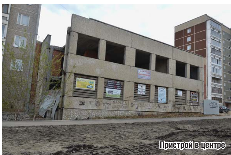
Пристрой в центре