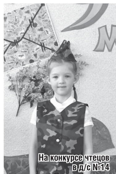
На конкурсе чтецов В/д/с №14

Ребята приняли участие и в других мероприятиях библиотеки, где им поведали о писателях-фронтовиках, о жизни Сысерти в годы войны, зачитали письма с фронта. Дети, в свою очередь, показали знание стихов о войне и даже рассказали о