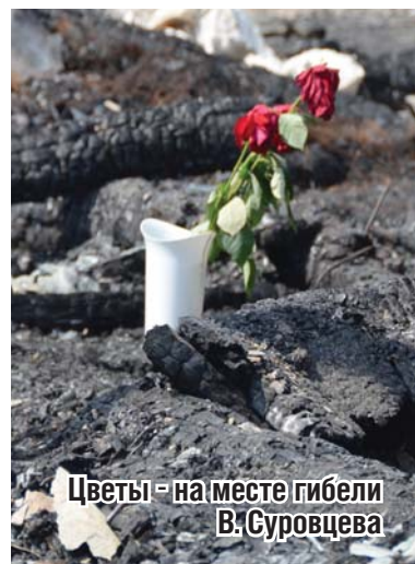
Цветы - на месте гибели В. Суровцева