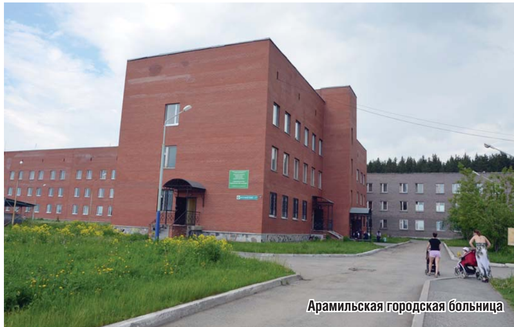
Арамилская городская больница

В этом отделении оказываются поддерживающая терапия для больных с неизлечимыми заболеваниями. Это и онкологические болезни, и неврологические, и с циррозом печени. Они проходят здесь курс лечения 21 день, кроме медикаментозной помощи с больными работает психолог. Паллиативная терапия – это смягчение проявлений неизлечимой болезни. На сегодняшний день в Арамилском городском округе около 1000 человек нуждается в такой помощи. Это отделение обслуживает 22 территории Свердловской области. В