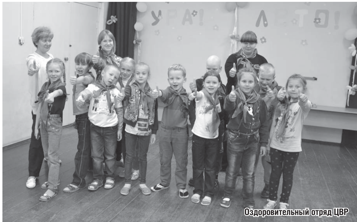
Оздоровительный отряд ЦВР