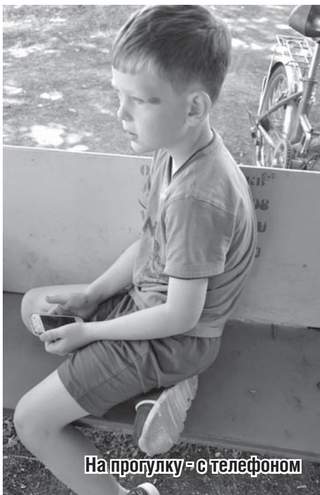
На прогулку – с телефоном

– У меня шестеро детей. Двое уже выросли и живут самостоятельно, двое школьного возраста (16 и 14 лет), и двое маленьких.