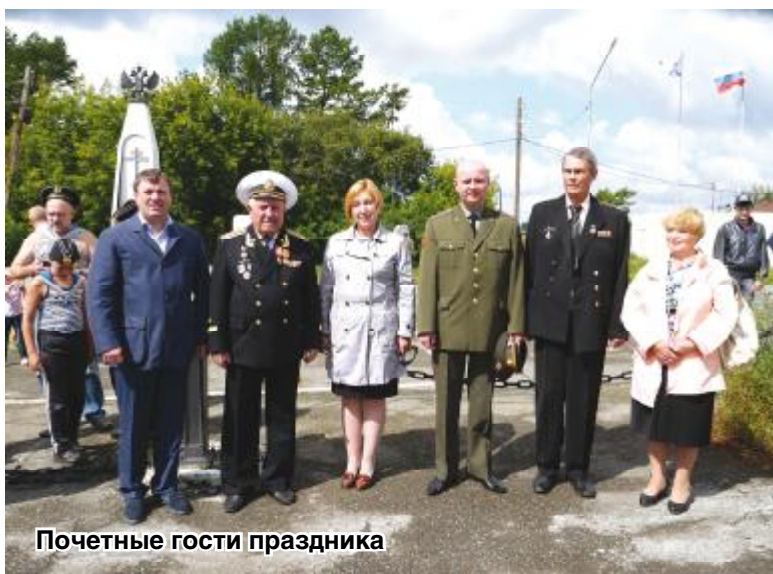
Почетные гости праздника