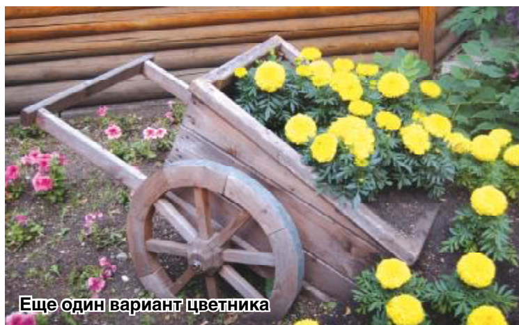
Еще один вариант цветника