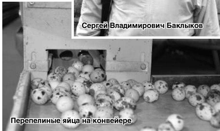
Перепелиные яйца на конвейере