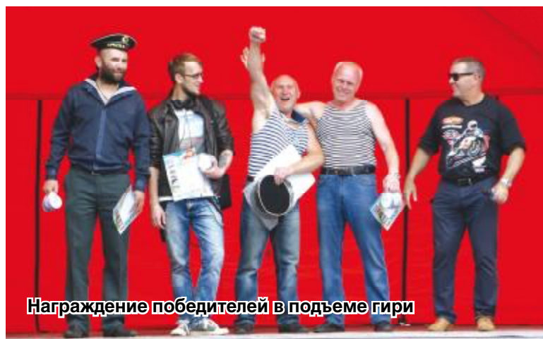
Награждение победителей в подъеме гири