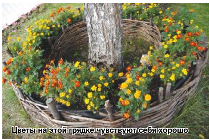
Цветы на этой грядке чувствуют себя хорошо

Если почва на участке сырая и вы боитесь, что весной из-за таяния снега у плодовых деревьев будут скапливаться излишки влаги, под данные грядки можно положить обрезки трубы под небольшим наклоном, чтобы влага эта уходила. Попробуйте! Каждый садовод – это в какой-то степени дизайнер.