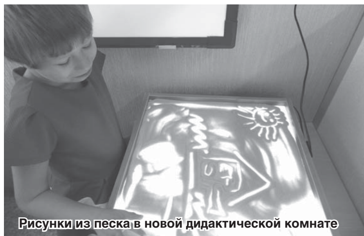
Рисунки из песка в новой дидактической комнате

Так, фонд приобрел диван-книжку и четыре кресла. Прочная и удобная мебель с