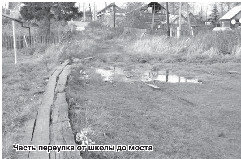
Часть переулка от школы до моста

Асфальт на переулке Школьном вообще развалился! Ходить невозможно. Инвалиды, старики, дети – все ноги ломают. Ни в амбулаторию не пройти нормально, ни к реке. Глава говорит, что денег нет. А нам-то что делать?