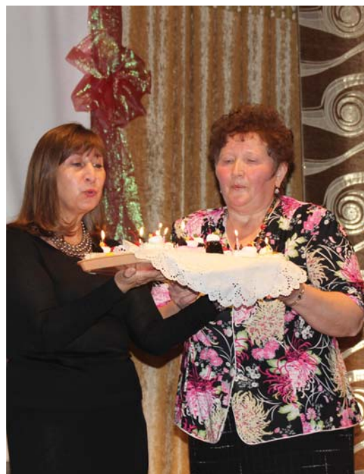
В. Харитонов, Фото автора. с. Никольское.

Творческие номера коллективов ДК сменяли друг друга, показывая то, чего достигли за эти годы, а благодарные зрители аплодировали артистам за их старание и мастерство.