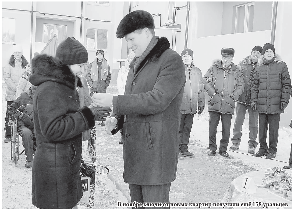
В ноябре ключи от новых квартир получили ещё 158 уральцев

Данное решение приняло федеральное правительство.