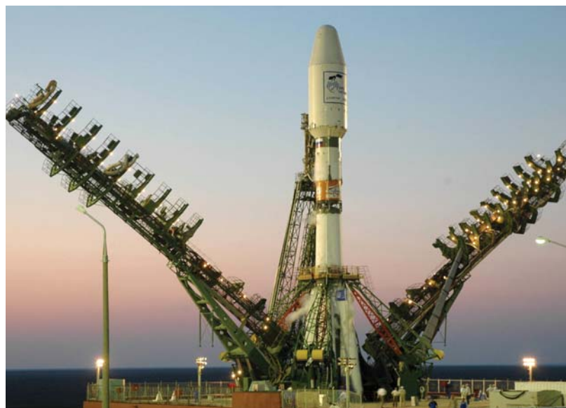
Победитель сможет поехать на старт реальной ракеты на Байконур

Завершится праздник отработкой космической тревоги, отправкой Деда Мороза на Альфа-Центавр и вручением подарков.