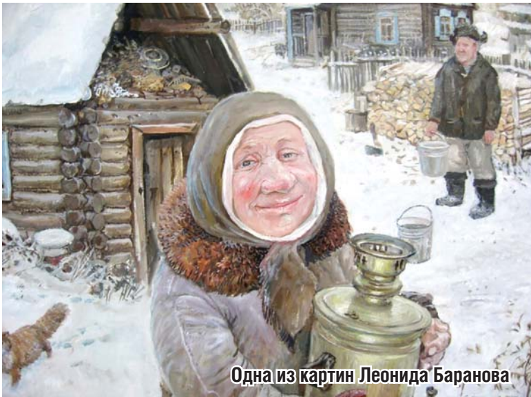
Одна из картин Леонида Баранова