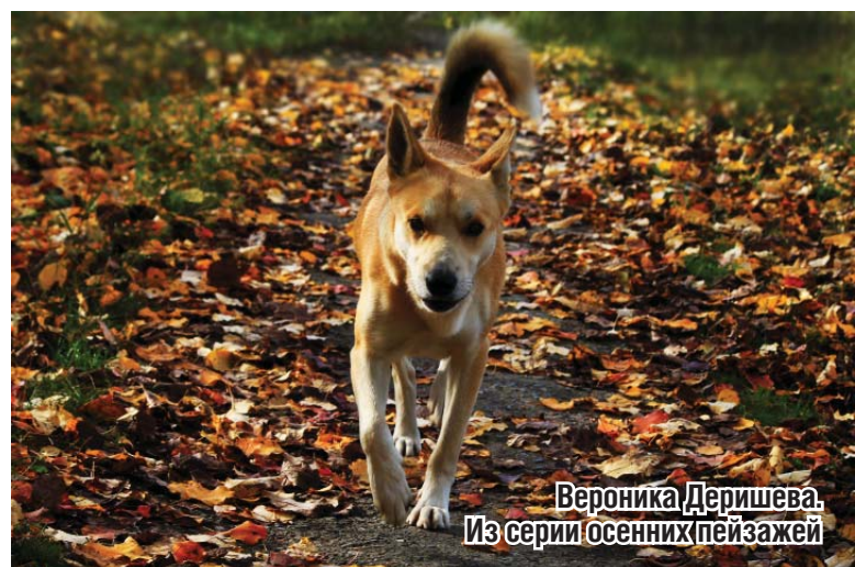
Вероника Деришева. Из серии осенних пейзажей