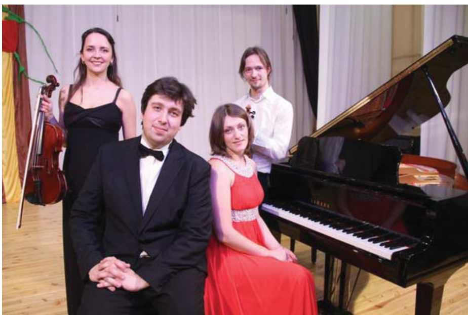
На сцене Сысертского городского центра досуга - гости из Москвы