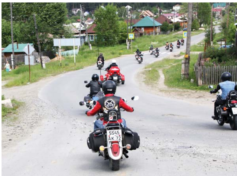
Мотоколонна едет по Сысерти