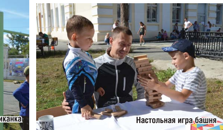
Настольная игра башня