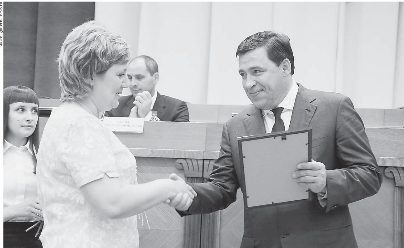
Евгений Куйвашев отметил, что в регионе обязательно будет продолжена работа по материальному стимулированию педагогов. Кроме того, отдельное внимание будет уделено повышению квалификации и решению жилищных проблем учителей.

«Одной из ключевых тем на областном педсовете стал вопрос снижения бумажной отчётности в наших школах. У нас есть поручение губернатора по широкому обсуждению этой проблемы с учительским сообществом. Евгений Куйвашев совершенно верно указывает на то, что в школах нам необходимо больше доверия нашим учителям, и меньше бумажной волокиты, бюрократии. Такие же установки дал председатель Правительства России Дмитрий Медведев».