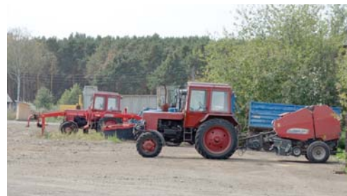
В этом году «Патруши» приобрели технику на 90 млн рублей

90 миллионов рублей в этом году собственники агрофирмы выделили на приобретение техники. Купили кормоуборочный комбайн «Нью холланд», трактор «Кейс» на 300