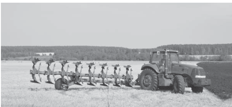
Трактор с оборотным плугом приехал на подмогу из Логиново