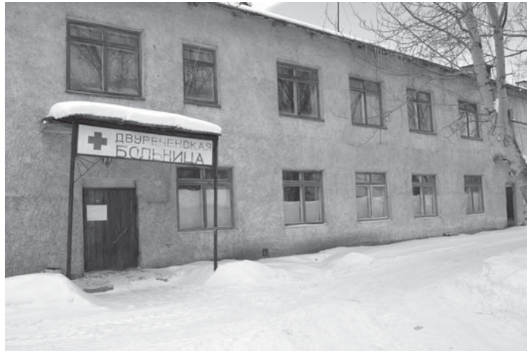
Здание, где до 2013 года располагался круглосуточный стационар, законсервировали

Местные чиновники – самое последнее звено в принятии таких важных решений. Практически все российские больницы сейчас находятся в жестких условиях. По большому счету, они могут жить только на те средства, которые заработали или сэкономили. Если потока больных нет – отделение приходится закрыть, врача сократить. Решения о закрытии