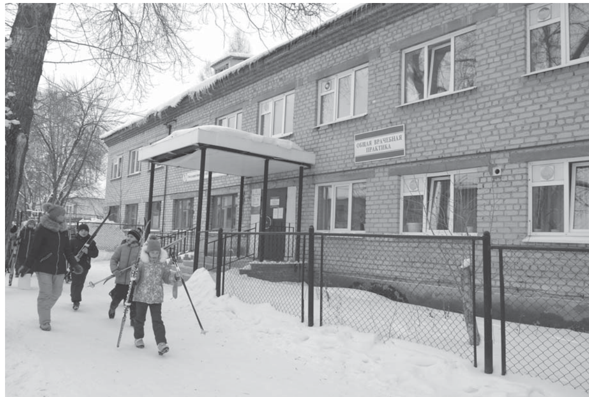
Три ОВП, кабинеты администрации и врачей, физпроцедуры, выдача молочной кухни - все теперь располагается в основном здании поликлиники