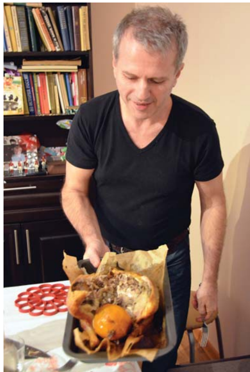
Второе блюдо - курица, запеченная с апельсином

– Жить в Италии на порядок дороже, чем в России. И если цены на продукты примерно одинаковые, то стоимость сервиса, коммунальных услуг и размер налогов за границей просто зашкаливает. Взять даже цены на проезд, где плата берется в зависимости от расстояния. А зимой люди включают отопление всего на 3-4 часа в день, потому что это считается роскошью. Учится молодежь очень долго, так как параллельно все стараются работать,