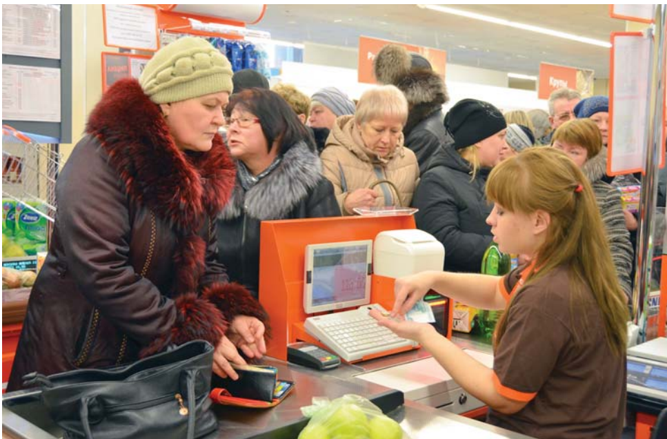
Уже спустя несколько минут после открытия в «Дикси» выстроились большие очереди покупателей