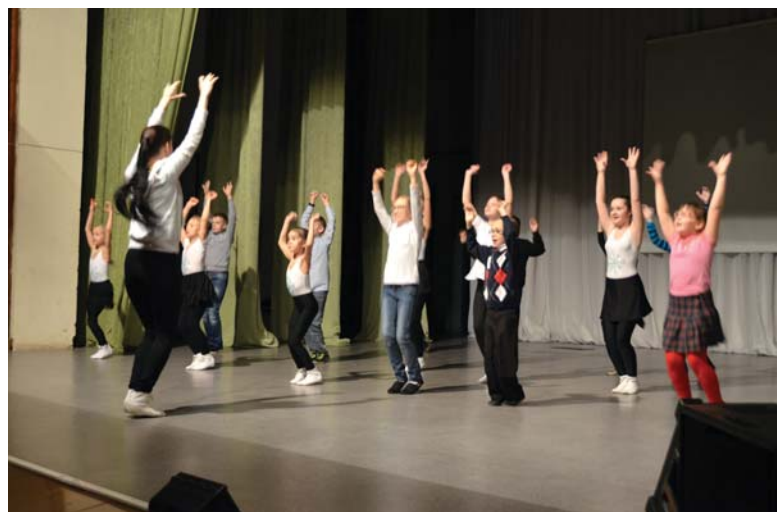
Танцевальная разминка для актеров обязательна

сценарий специально под каждого актера. Конечно, бывают замены, но это – редкость.