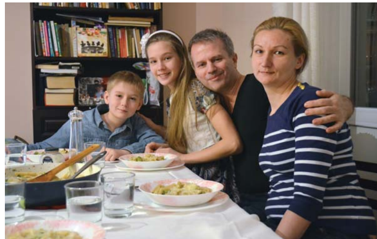
Все вместе - за семейным столом