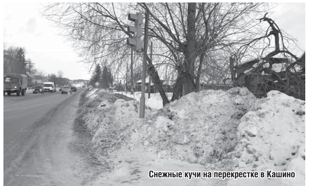
Снежные кучи на перекрестке в Кашино

ОТ РЕДАКЦИИ: Наверное, многие из наших читателей видели объявление, которое висит на кассах в «Кировский»: мол, уважаемые покупатели, в связи с техническими неполадками возможно несоответствие цен. Правомерно ли это? Мы попросили территориальное отделение Роспотребнадзора и прокуратуру разобраться в данной ситуации. Будем следить за решением проблемы.