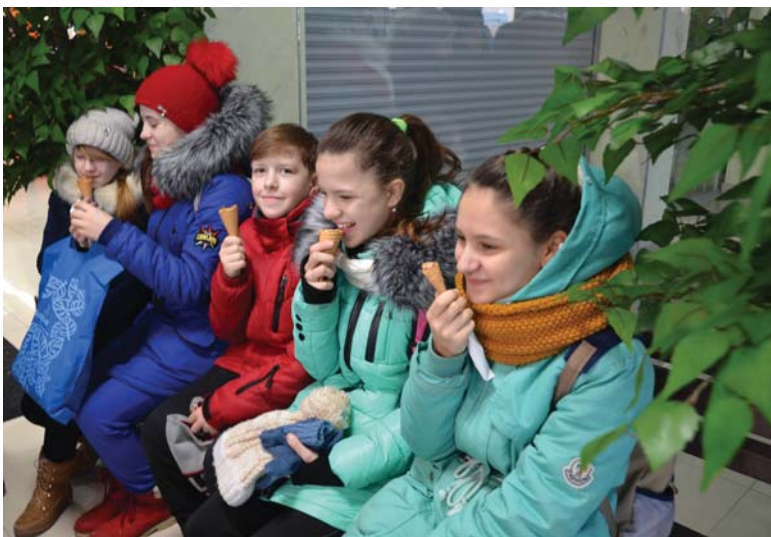
Ребята с аппетитом поедали мягкое мороженое

На протяжении всех выходных стоянка была заполнена машинами. А это значит, что новый торговый центр уже стал местом притяжения горожан. Сможет ли он удержать свои позиции в условиях конкуренции и кризиса – покажет время. А пока можно порадоваться большим скидкам и акциям, которыми арендаторы востро подогревают интерес горожан.