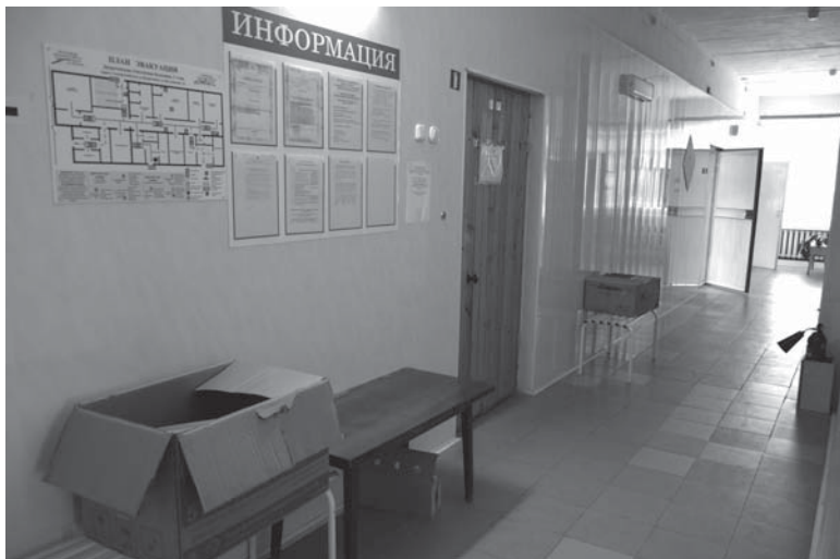
В бывшем стационаре готовятся к переезду

- Все это в советские времена принадлежало больнице – здесь прачечная была, там столовая, тут регистратура и прием врачей, рентген-кабинет, родильное отделение, а в том здании, где сейчас ОВП – профилакторий для работников завода. Все было, а сейчас и не знаю – может, кому-то это здание продадут? Я живу рядом, мне интересно, что здесь будет.