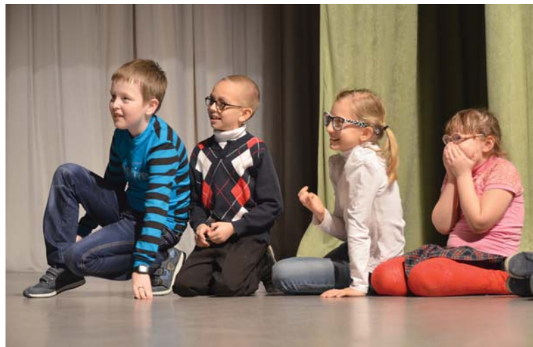
Занятие по актерскому мастерству