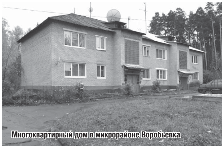
Многоквартирный дом в микрорайоне Воробьевка

Все еще ждут тепла в свои квартиры жители микрорайона Воробьевка в Сысерти.