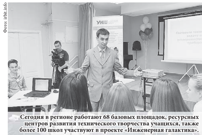
Сегодня в регионе работают 68 базовых площадок, ресурсных центров развития технического творчества учащихся, также более 100 школ участвуют в проекте «Инженерная галактика».

Отметим, что в 2016 году благодаря проектам областного Дворца молодёжи и Института развития образования в Свердловской области почти на 60% увеличилось число детей, занимающихся техническим творчеством.