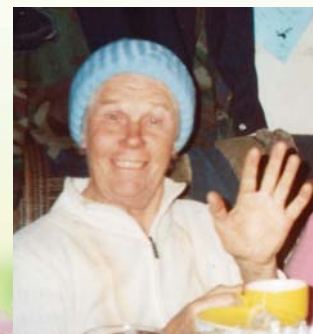
Дети, внуки, правнуки.

Первое число – День рождения мамы! С Днем рождения тебя, Мама милая моя, Пусть тебя твой добрый Ангел хранит!