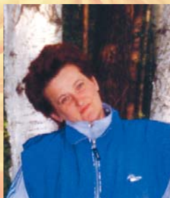
С любовью, твои друзья.

поздравляем с юбилеем и выходом на пенсию. Здоровья тебе родная! Будь всегда красивой и жизнерадостной.