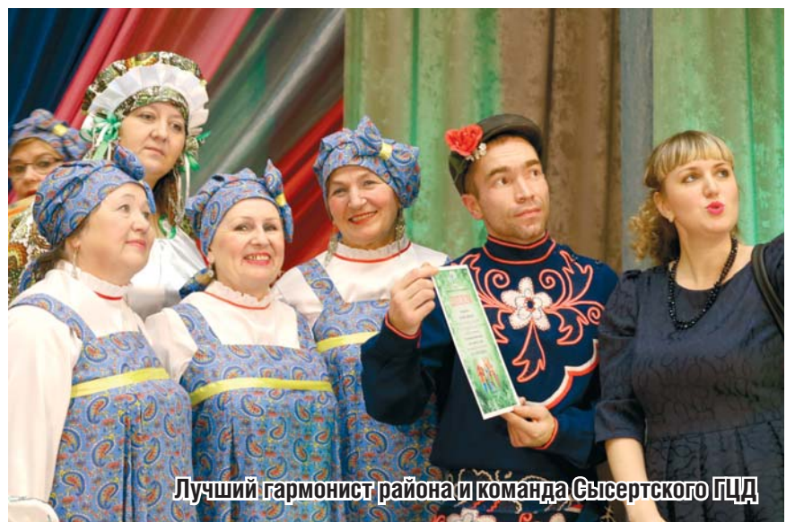
Лучший гармонист района и команда Сысертского ЦД