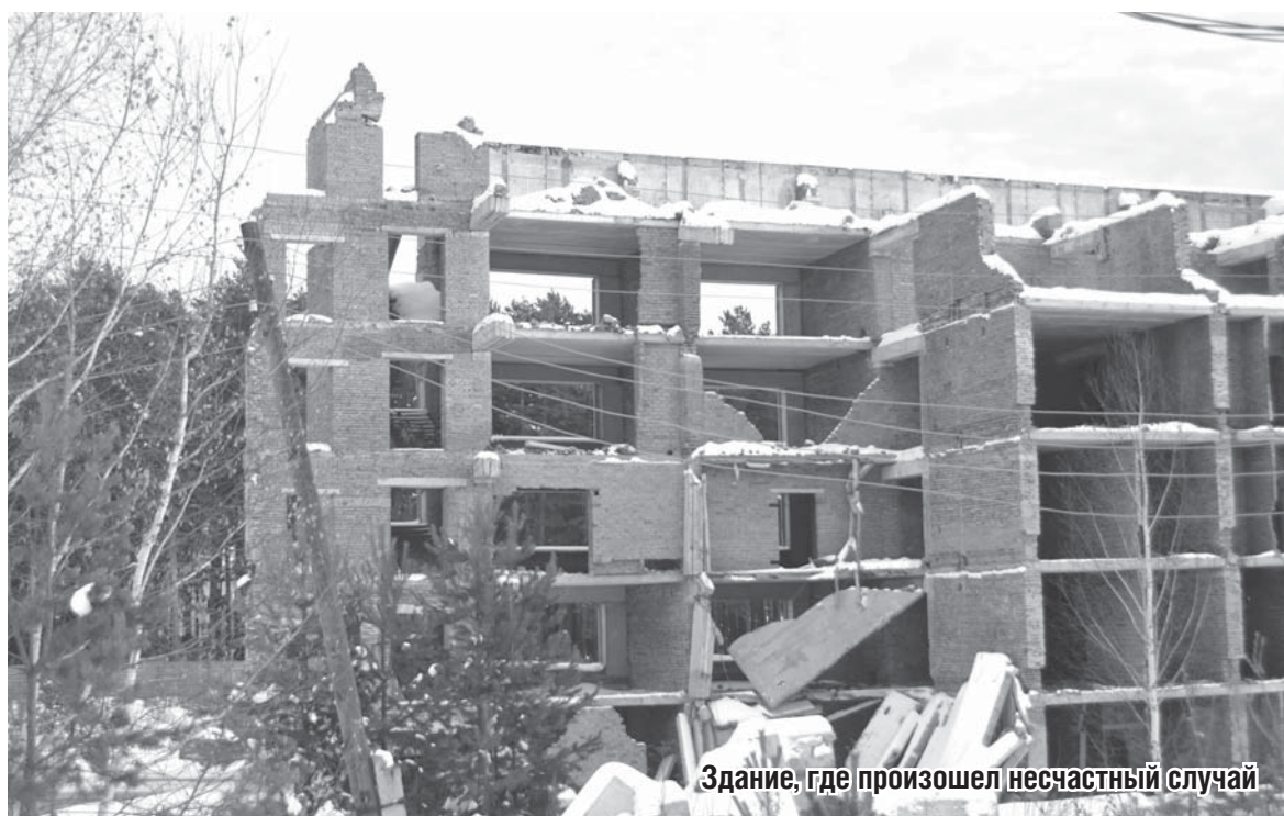
Здание, где произошел несчастный случай

– От ответственности уйти не пытаюсь, от следователей не скрываюсь и от семьи Аваза Батирова тоже. Все время, пока он лежал в больнице, я был на связи с его родными и лечащим