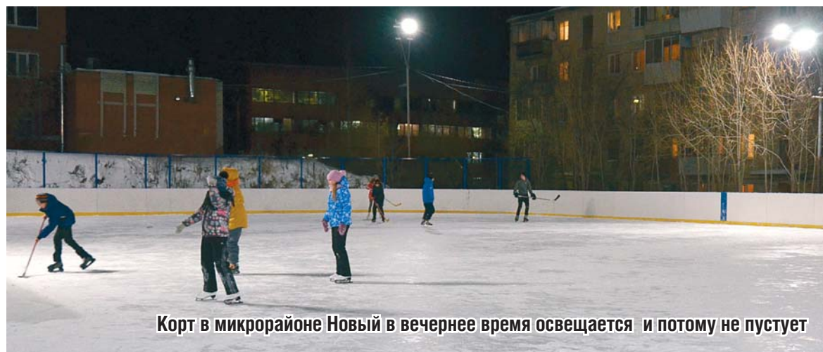
Корт в микрорайоне Новый в вечернее время освещается и потому не пустует