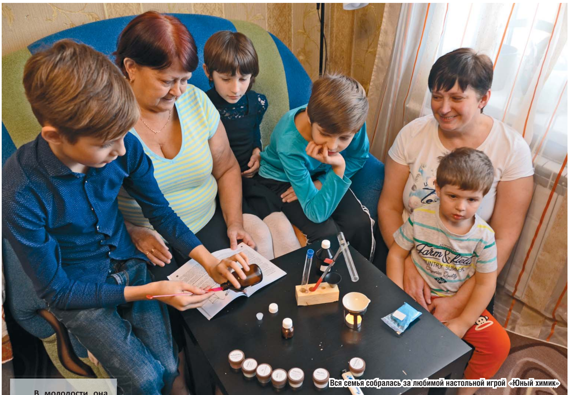
Вся семья собралась за любимой настольной игрой «Юный химик»