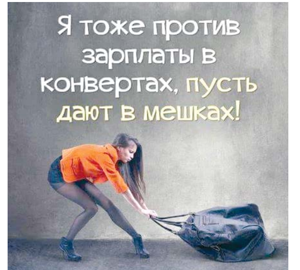
Ответы на сканворд - на стр. 30

Послушав на ночь сказку "Волк и семеро козлят", ребенок задал вполне логичный вопрос: - А где все это время был папа-козел?